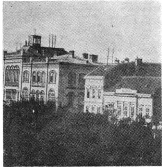
Краљев трг око 1911: поред Капетан Мишиног здања виде се зграде Народног музеја и Општине

La Place du Roi à Belgrade, vers 1911: à côté de l'édifice «Kapetan Mišino zdanje» l'Université, on voit les édifices du Musée national et de la Municipalité