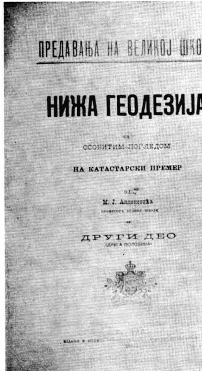
Факсимил уџбеника којим су се служили ђаци Велике школе

Правила о штампању великошколских уџбеника регулисала су значајно питање. У њима је најпре прописано да уџбеници буду кратки, концизни и писани на основу програма; морају бити подешени за наставу и испите. Рукописе уџбеника оцењују факултети, а хоноришу се подједнако. 61 Самостално израђени уџбеник награђиваће се одсеком са 6.000 динара, а преведени са 4.000 динара. У једној од одредаба Правила говори се и о тиражу. У истом броју ће се штампати уџбеници Филозофског и Техничког факултета за оне предмете који су обавезни за слушаоце свих одсека, док ће се уџбеници за специјалне предмете штампати у 500 примерака. Приликом прештампавања писац ће се награђивати половином износа прве награде „ако га морадне знатно прерађивати“, а четвртином ако се прештампавање врши с малим изменама и допунама. Последњи члан Правила гласи: „Редовни ученици Велике школе дужни су у семинарима и на испитима доказати да