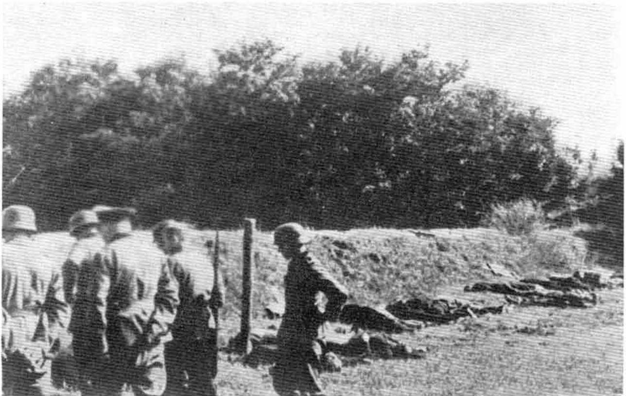
Стрељање у Јајинцима