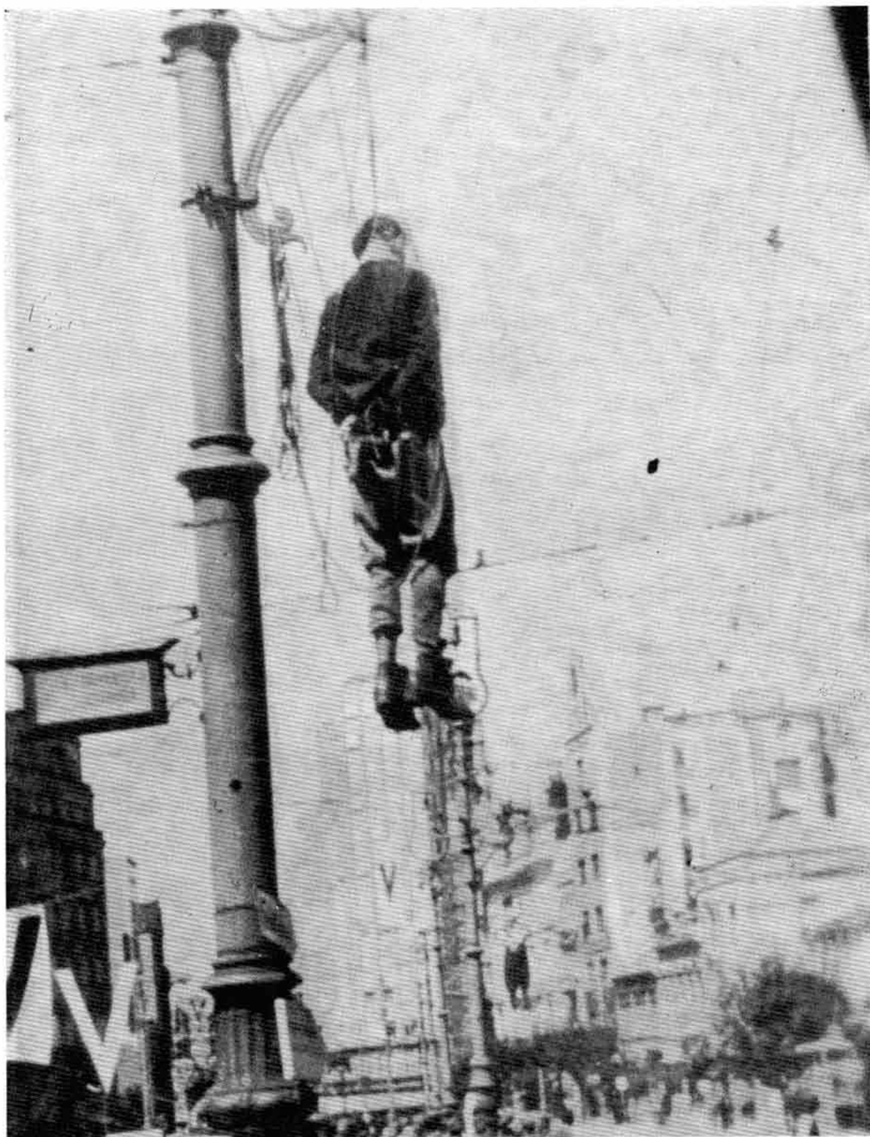
Теразије 17. августа 1941.