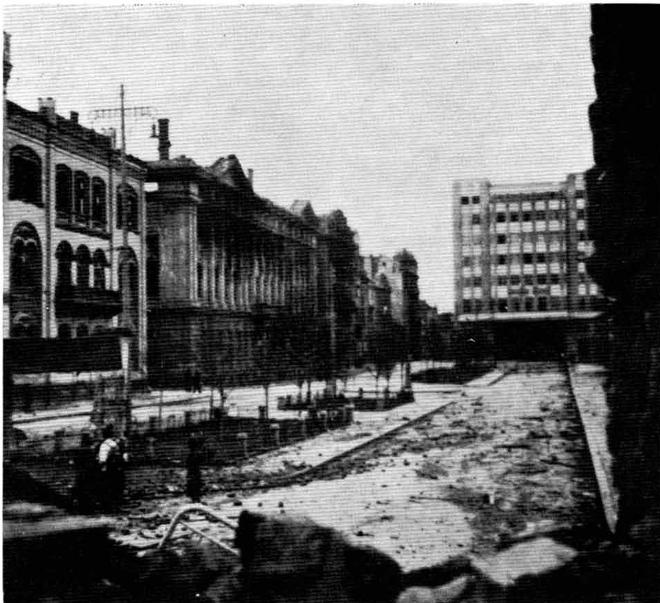
Студентски трг 20. октобра 1944. године