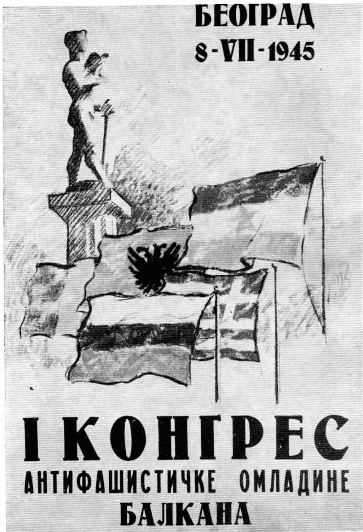
Мило Милуновић, плакат 1945.