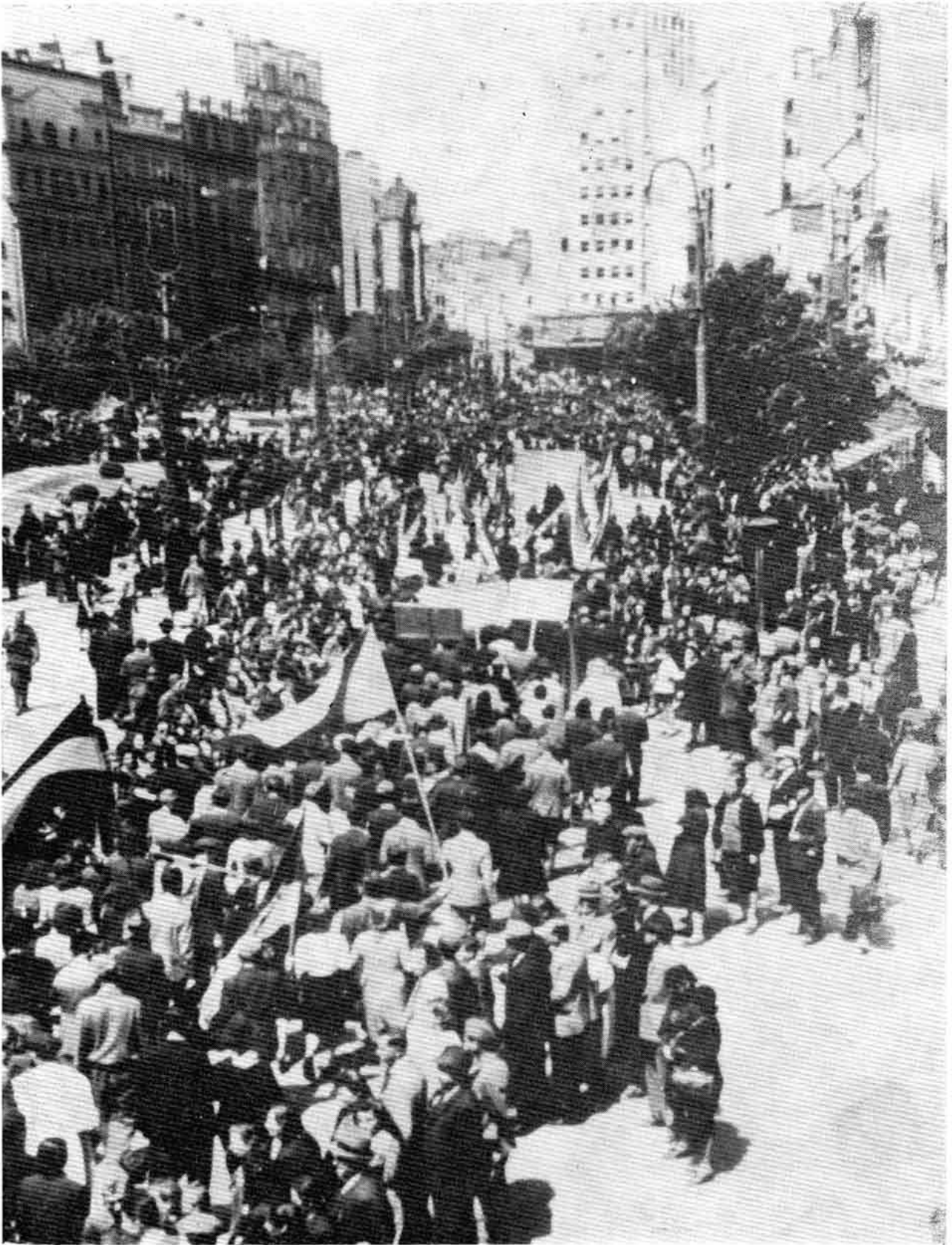
Прослава Дана победе у Београду 1945. године La célébration du jour de la victoire à Belgrade 1945