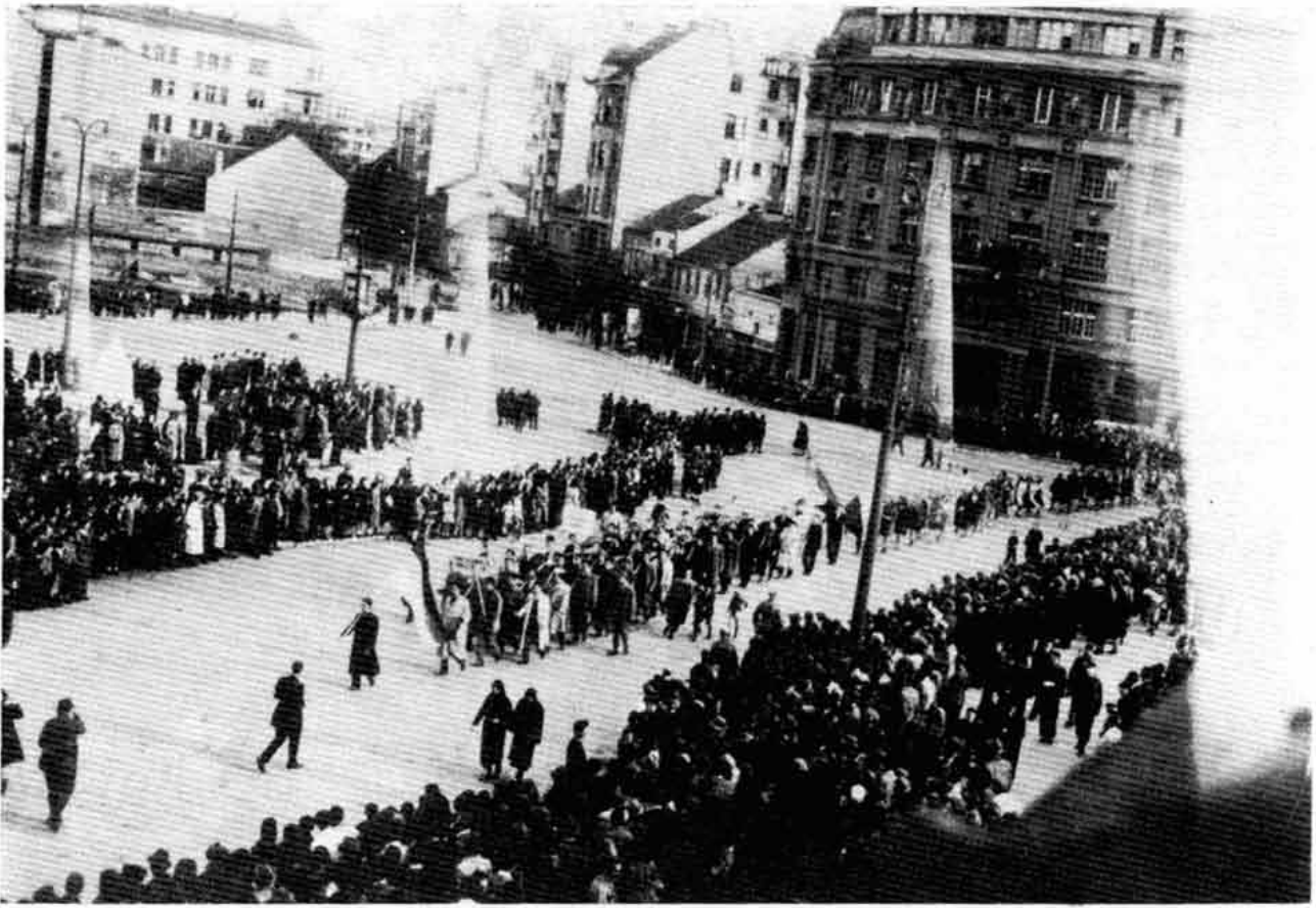
Сахрана црвеноармејаца октобра 1944. године у Београду

Les obsèques des soldats de l'Armée rouge à Belgrade en octobre 1944