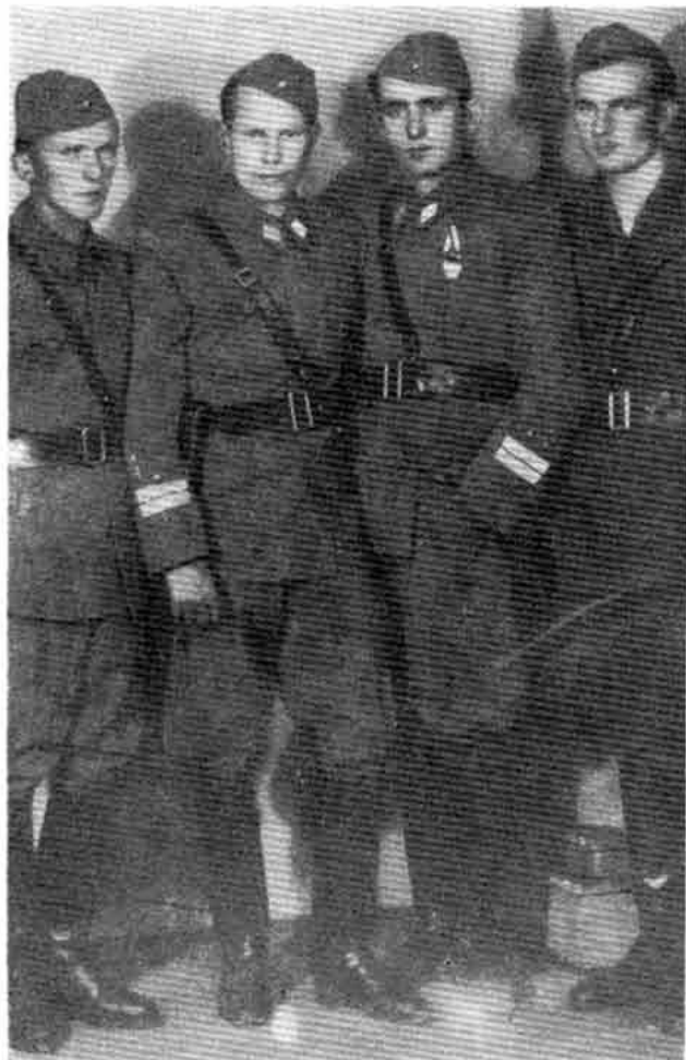
Штаб III пролетерске у Београду — X 1944. г.

Организовање партијских организација био је проблем којим су се бавили и рејон-