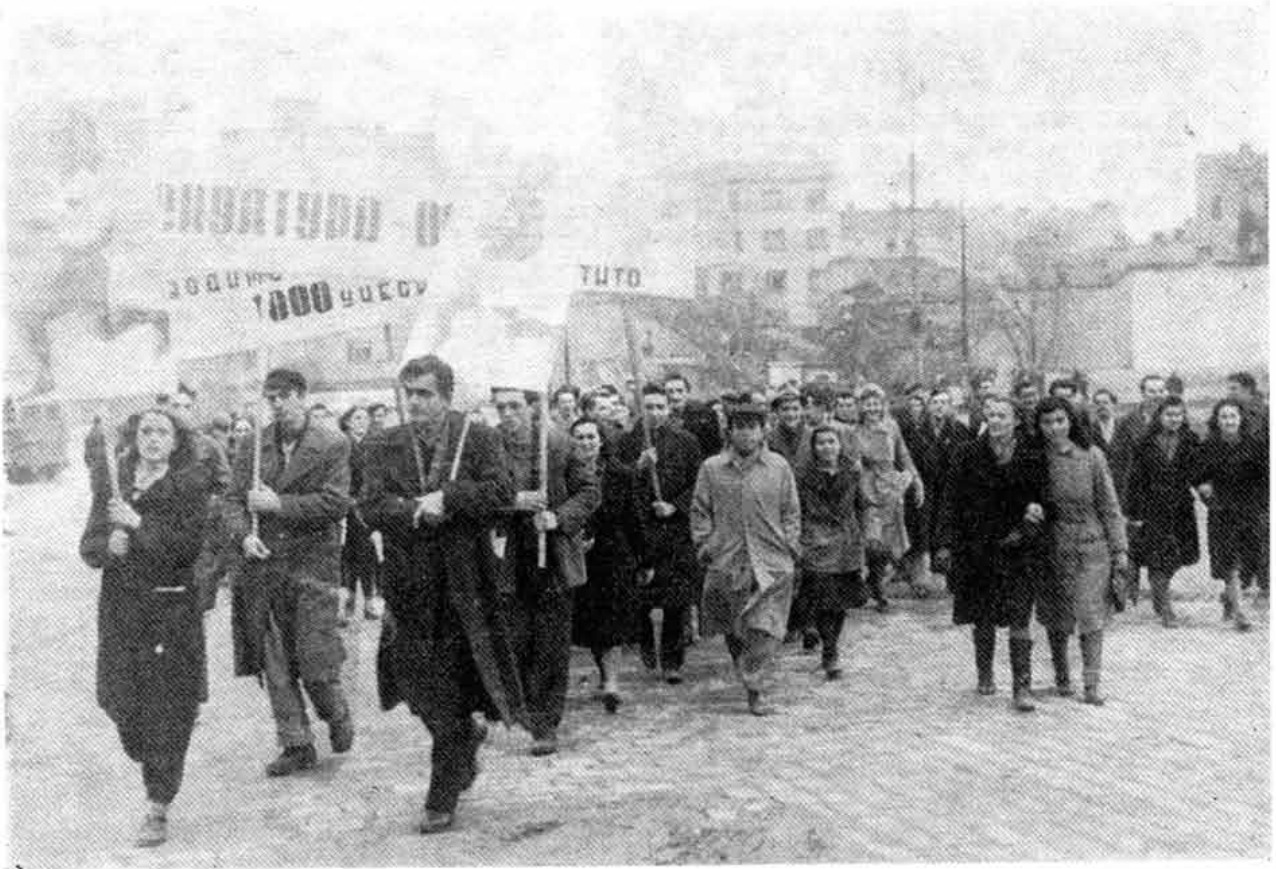
Учесници првог кроса у Београду 1945. године Les participante du premier cross à Belgrade 1945

Месни комитет је непосредно или у договору са ПК Србије распоређивао чланове Партије на рад у државне органе и друге установе и то углавном на руководећа места и у персонална одељења. Више него у предузећима, било је нужно у установама верифицирати службенике који се нису огрешили о НОБ за време рата. Све оне који су активно сарађивали са четницима или окупатором требало је одстранити из администрације предузећа и из установа.