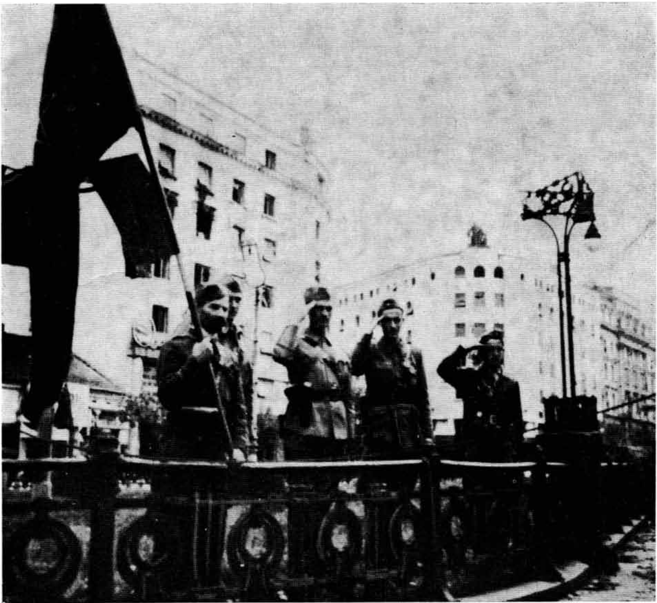
Штаб I пролетерске бригаде у Београду 20. X 1944. године

Писмено саобраћање са партијским комитетима било је изузетно и то углавном када се радило о повременим извештајима о раду. Званичног писменог саобраћања комитета са органима власти или масовним организацијама уопште није било.