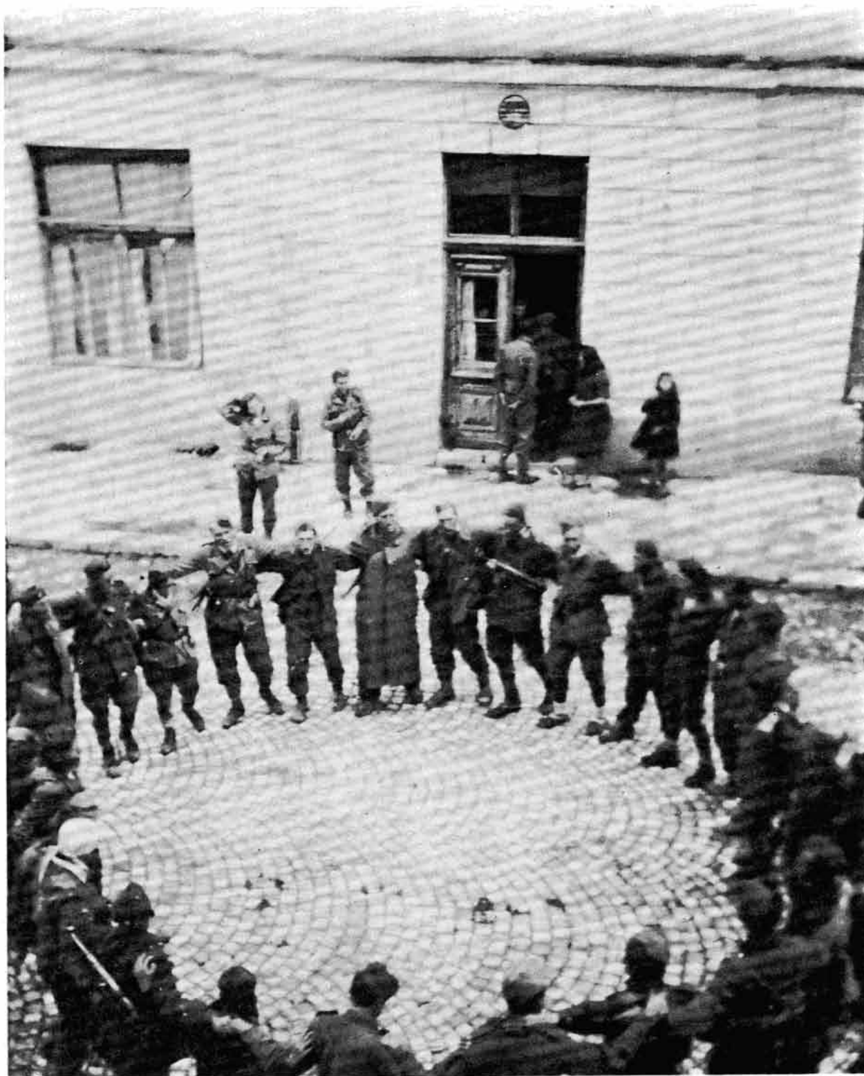
Козарачко коло на улици у Београду 1944. године