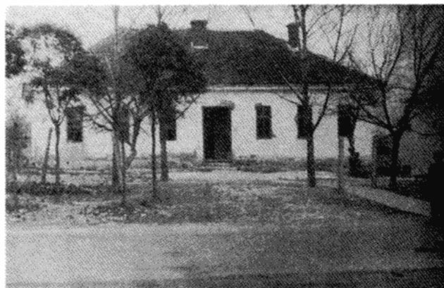
Стара школа у Сремчици из 1878. године