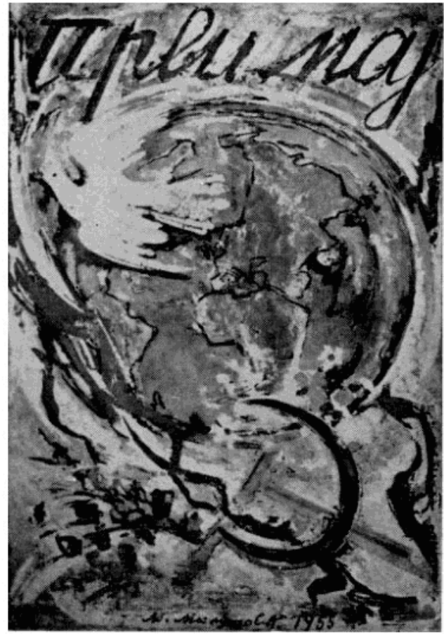
Првوماјски плакат из 1955. године. Рад Мила Милуновића

Affiche du 1-er mai 1955. Oeuvre de Milo Milunović