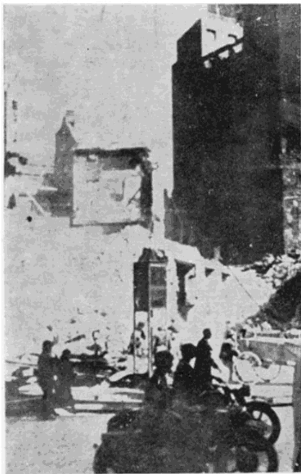
Немачке патроле у Београду 1941.

У таквој атмосфери није било тешко непријатељу продрети у град без борбе. Када је група од девет војника СС-дивизије Рајх под вођством једног капетана добила налог да извиди одбрамбене положаје града, она је без икакве сметње 12. априла после подне пролазила улицама града. Изненађена лакоћом извршеног задатка она се упутила немачком посланству, где су јој у сусрет изашли службеници који су на челу са отправником послова остали неометани у Београду. Одмах су извесили кукасти крст на згради посланства. 8 Чим се прочула ова вест, квислинзи су се јавно ставили у службу непријатеља, иако је рат још трајао. Потпредседник општине у функцији председника, који је побегао, дошао је већ око 7 сати увече Немцима да им преда град и да прими од њих даља наређења. Њему је одмах наређено да изда проглас становништву, да га позове на мир и покор-