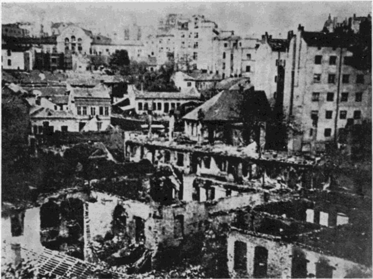
Београд 6. априла 1941.