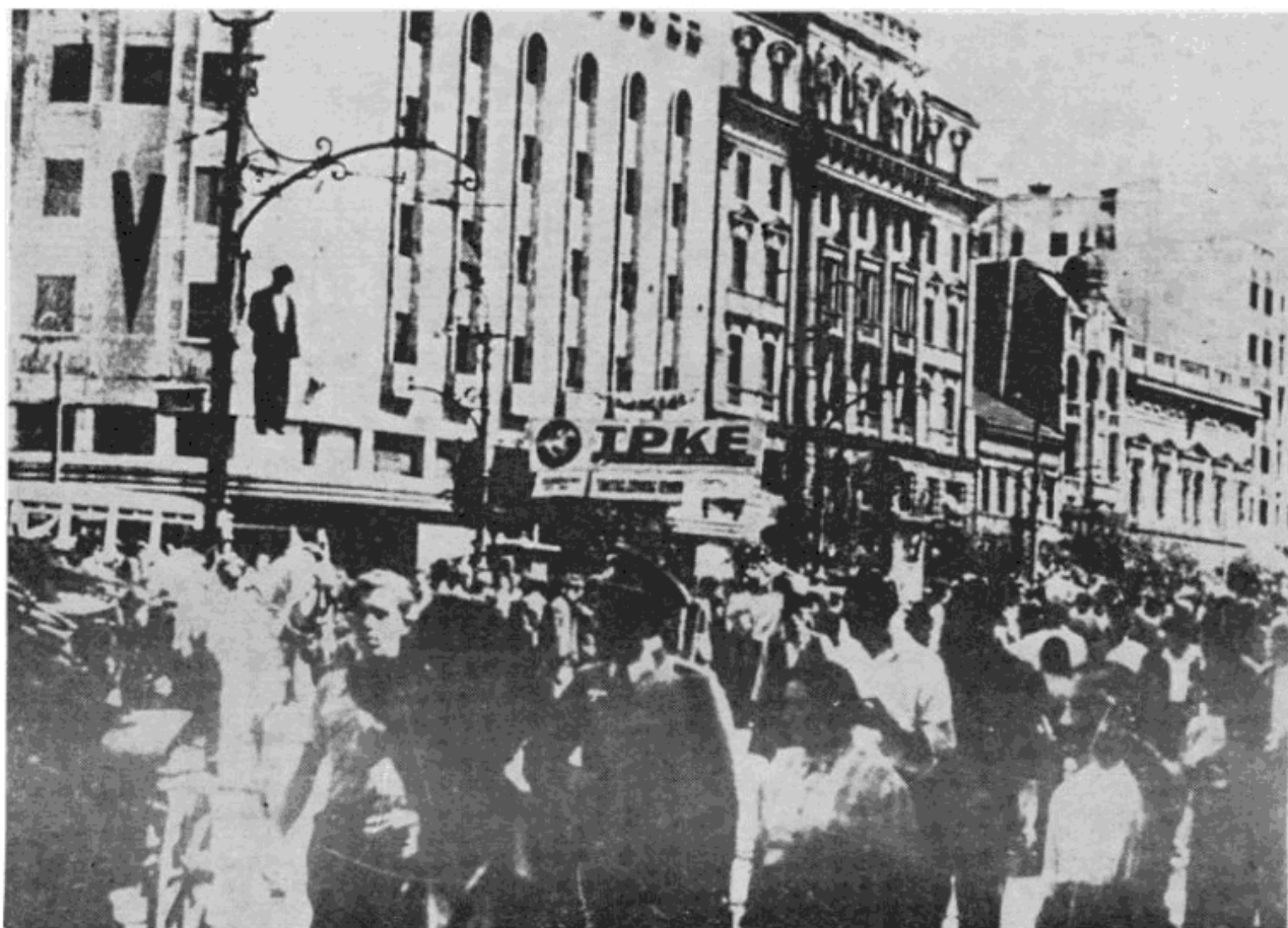
Теразије на дан 17. августа 1941.