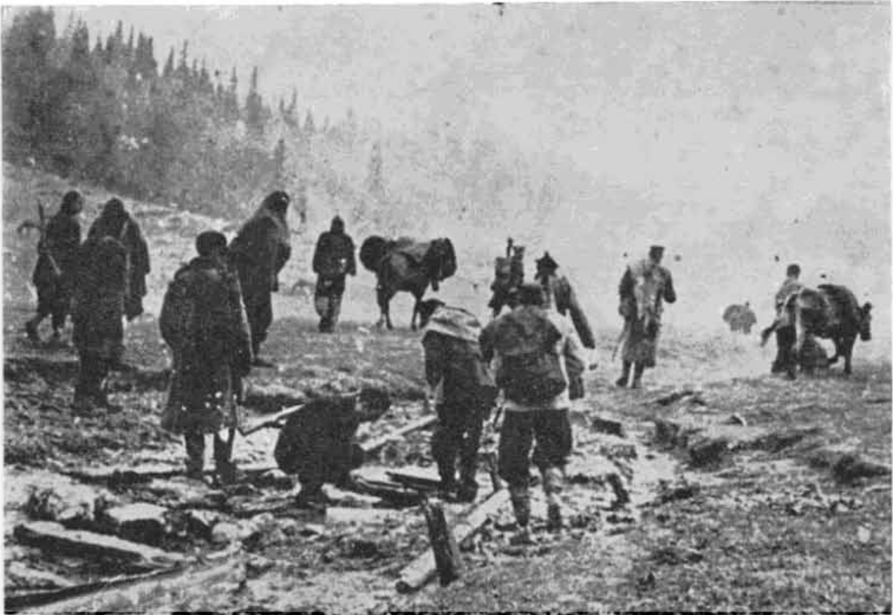
Борци Прве пролетерске бригаде за време Пете непријатељске офанзиве