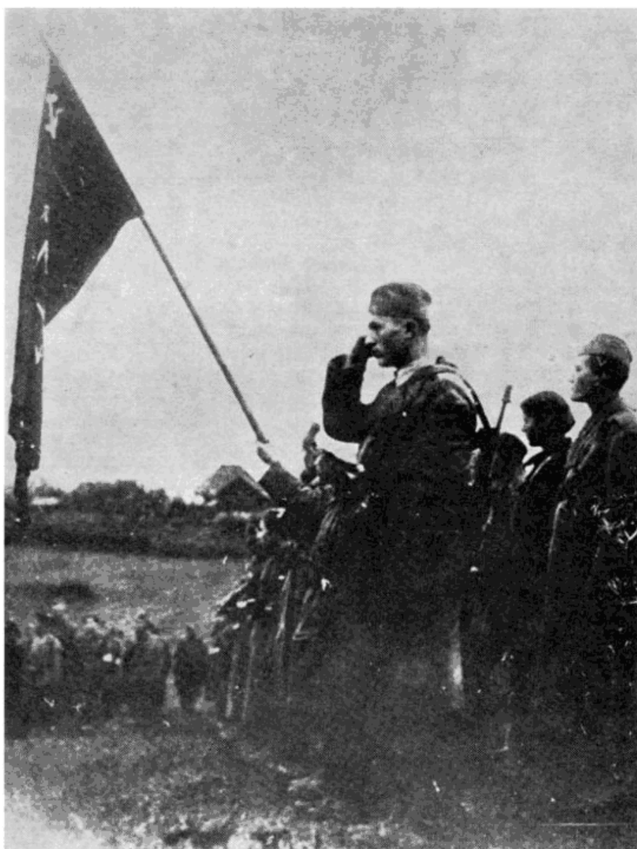
Београдски батаљон приликом предаје заставе у Босанском Петровцу, новембра 1942.

Le bataillon de Belgrade lors de la remise du drapeau à Bosanski Petrovac, en novembre 1942.