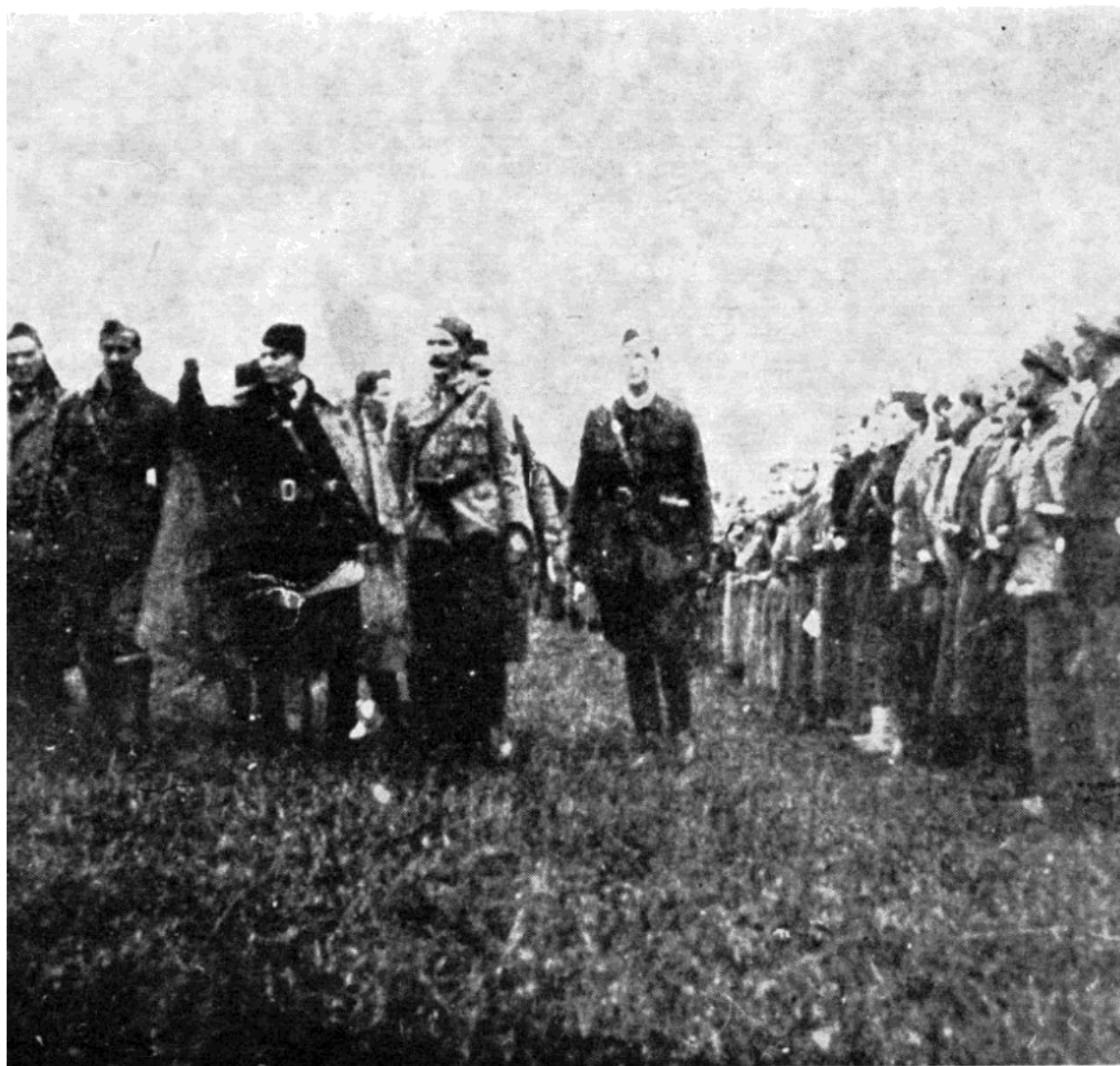
Прва пролетерска бригада на дан предаје заставе у Босанском Петровцу новембра 1942.