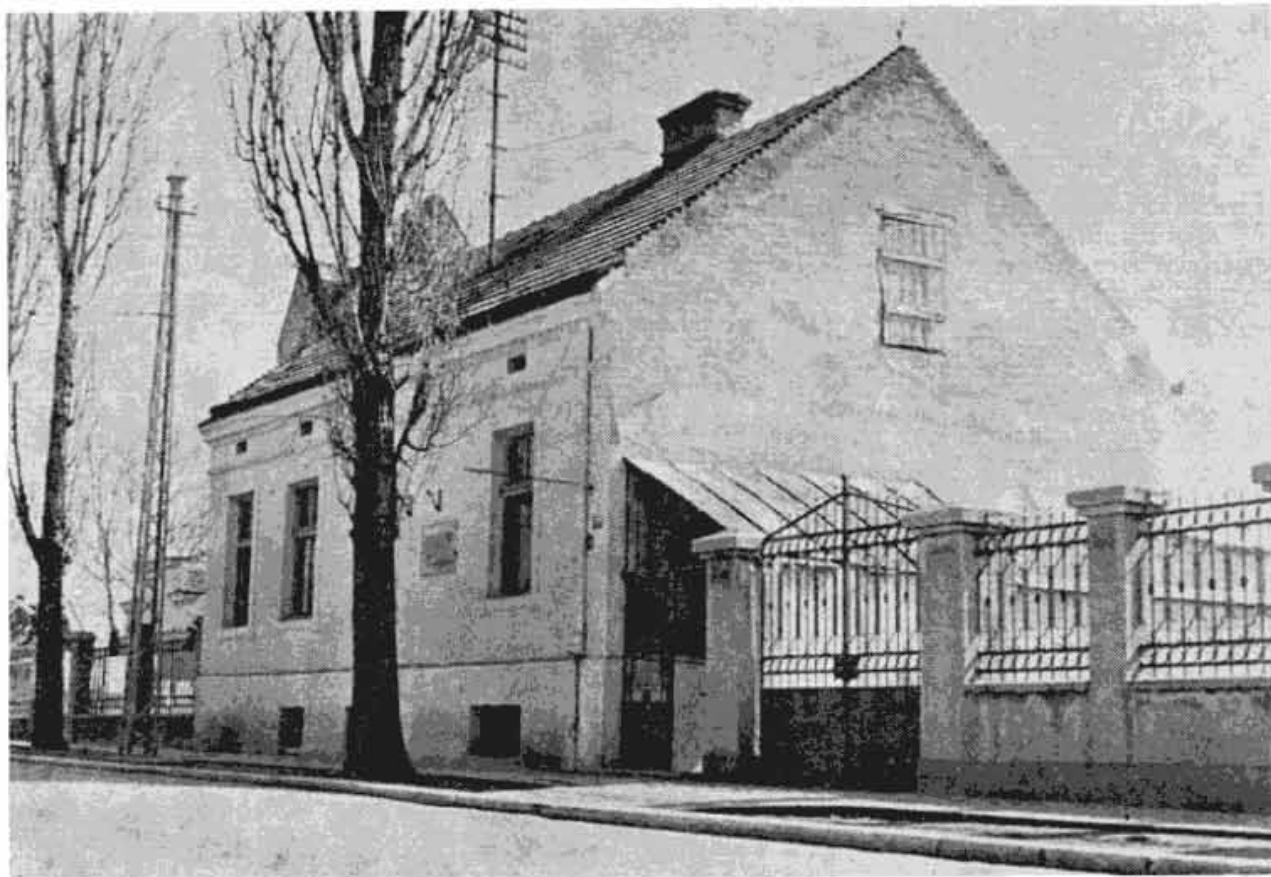
Зграда у Устаничкој улици бр. 24 у којој је била сакривена архива ЦК КПЈ у току 1942—1944.