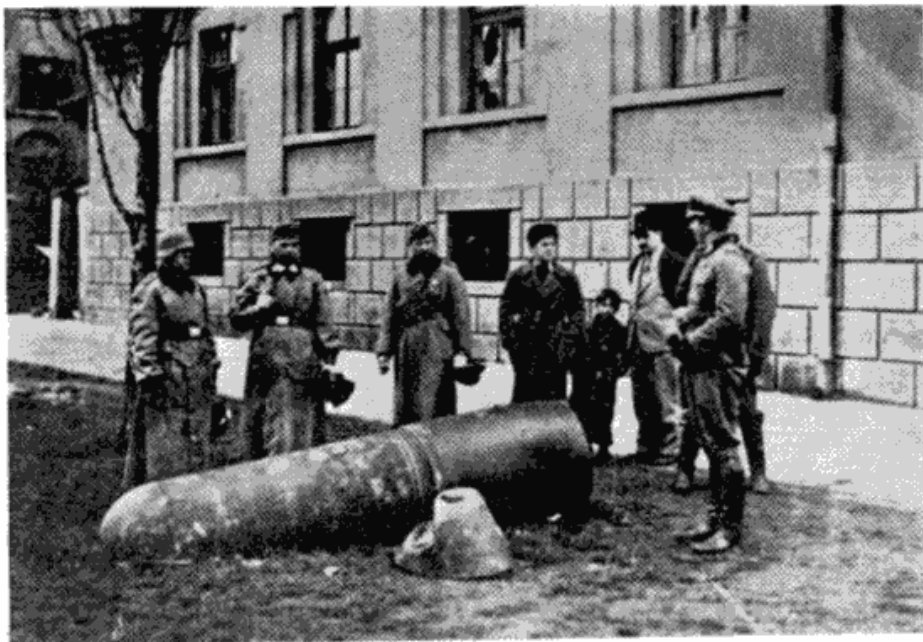
Немци крај неексплодираних авионских бомби бачених 6. априла 1941. у Штротсмајеровој улици (садашња Савска улица)