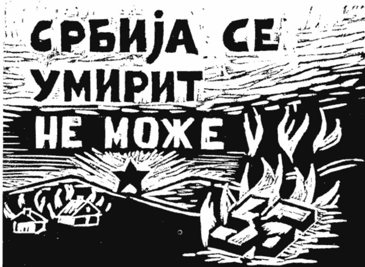
Плакат растуран у окупираном Београду. Линорез В. Нановића Affichette diffusée dans Belgrade occupé. Linotypic V. Nanović

Акција је извршена истовремено у целом Београду, рано ујутру када су улице биле најживље и пуне радника и службеника који одлазе на посао. Обично су ишле групе од три омладинца. Први, најснажнији и најокретнији имао је задатак да истргне продавцу новине из руку и да га спречи у евентуалном покушају да спасе своје примерке. Други је носио кантицу или флашу с бензином којим је поливао расуте новине. Трећи је имао спремљене шибице и палио бензин. Другарице су