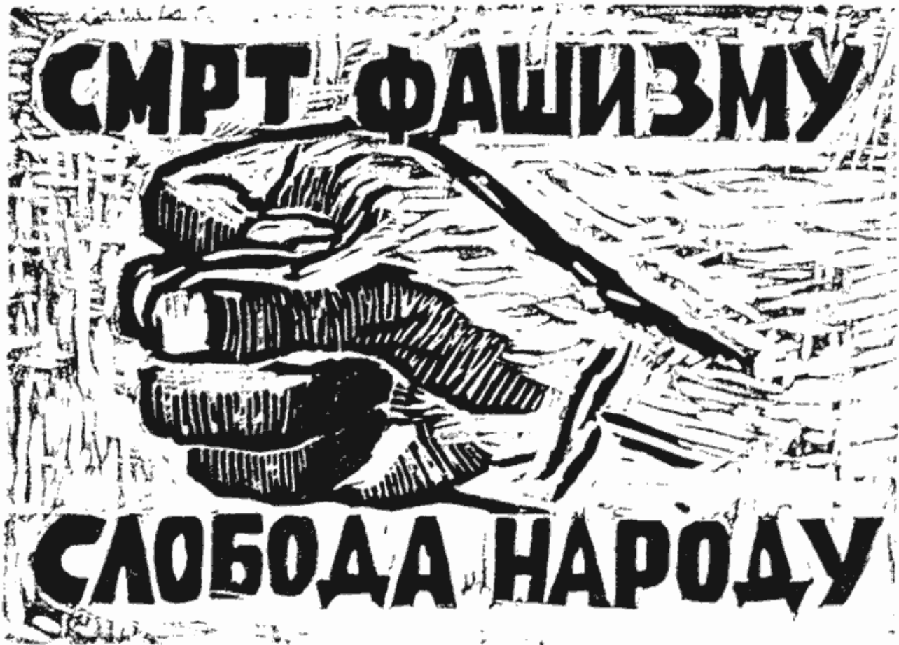
Плакат растуран у окупираном Београду. Линорез В. Нановића Affichette diffusée dans Belgrade occupé. Linotype V. Nanović

сака. Нарочито је ишло тешко са паролом „Србија се умирит не може“, уз коју сам направио прилично компликован цртеж, који је било скоро немогуће равномерно отиснути. Искрсао је још један проблем који нисмо предвидели. То је било сушење листића. Нисмо их смели стављати један преко другог, јер су се ионако неравномерне копије мрљале и боја се размазивала. Све нам је то успоравало рад.