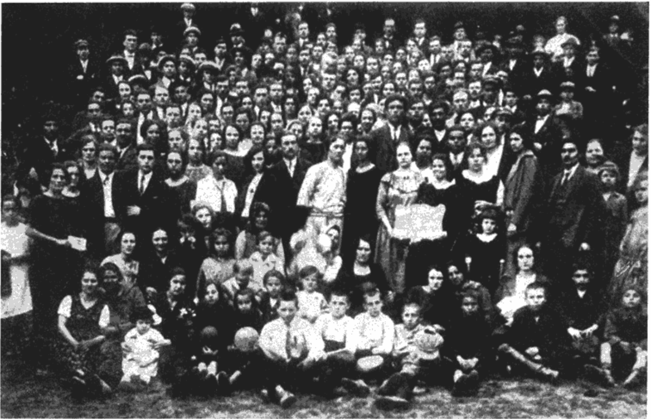
Сл. 5 — Група радника са породицама на прослави Првог маја 1923. године у Кошутњаку.

Живео Први мај! Живео осмочасовни радни дан! Живео јединствени фронт пролетаријата! Живео мир са Совјетском Русијом“.