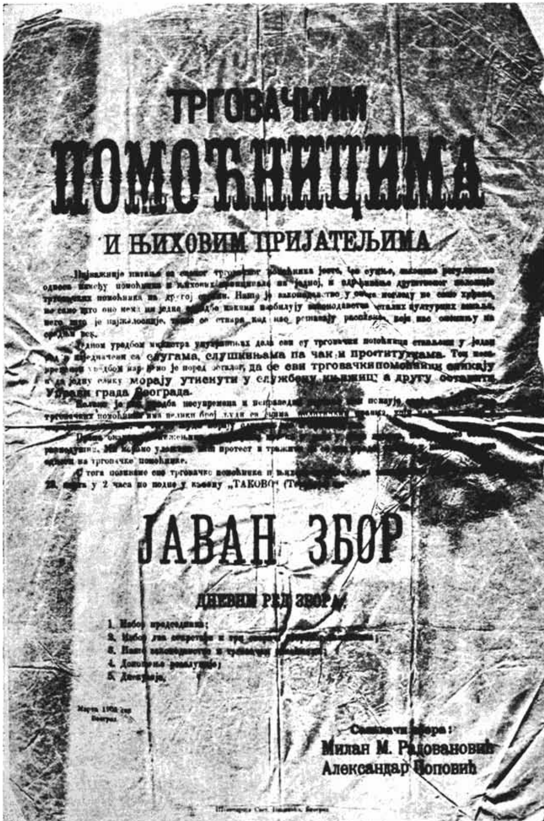
Сл. 12 — Факсимил плаката трговачких помоћника — позив на протестни збор.