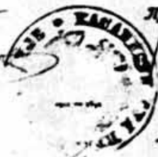
Сл. 14 — Факсимил одлуке Касационог суда да се одобрава решење о притвору именованих демонстраната. Историјски архив Београда.