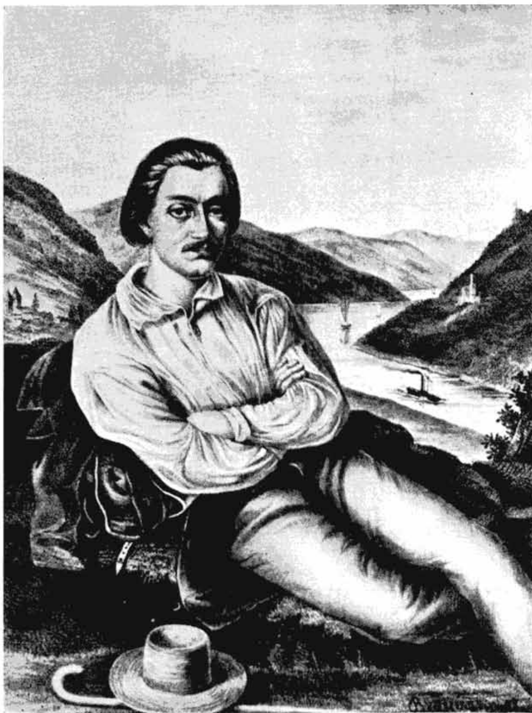
Сл. 1 — Edvard Braumann: „Љуба Ненадовић“, литографија, 1849. Народни музеј у Београду.