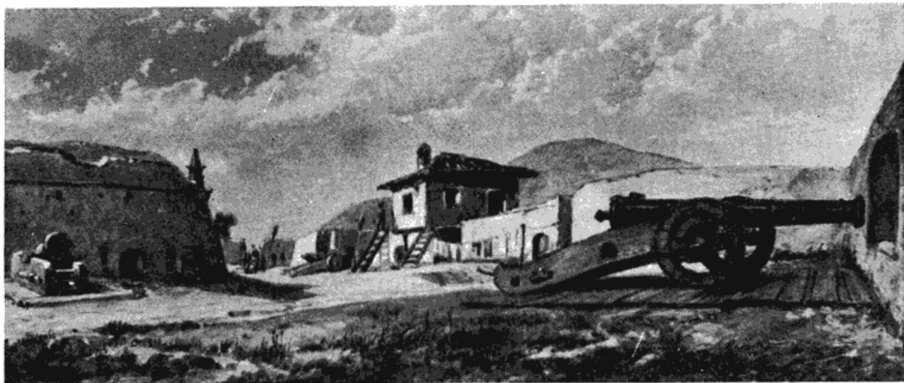
Сл. 3 — Felix Kanitz: „Ада-Кале“, акварел, 1861. Народни музеј у Београду.