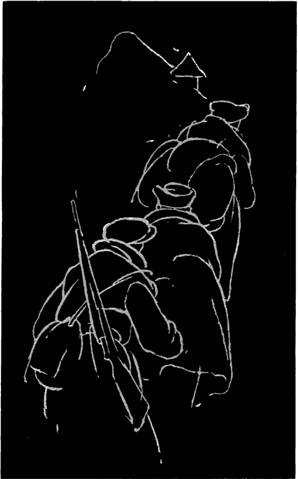
Сл. 2 — „Колона у маршу, ноћу“. Гравира. Рад Пиве Караматијевића.