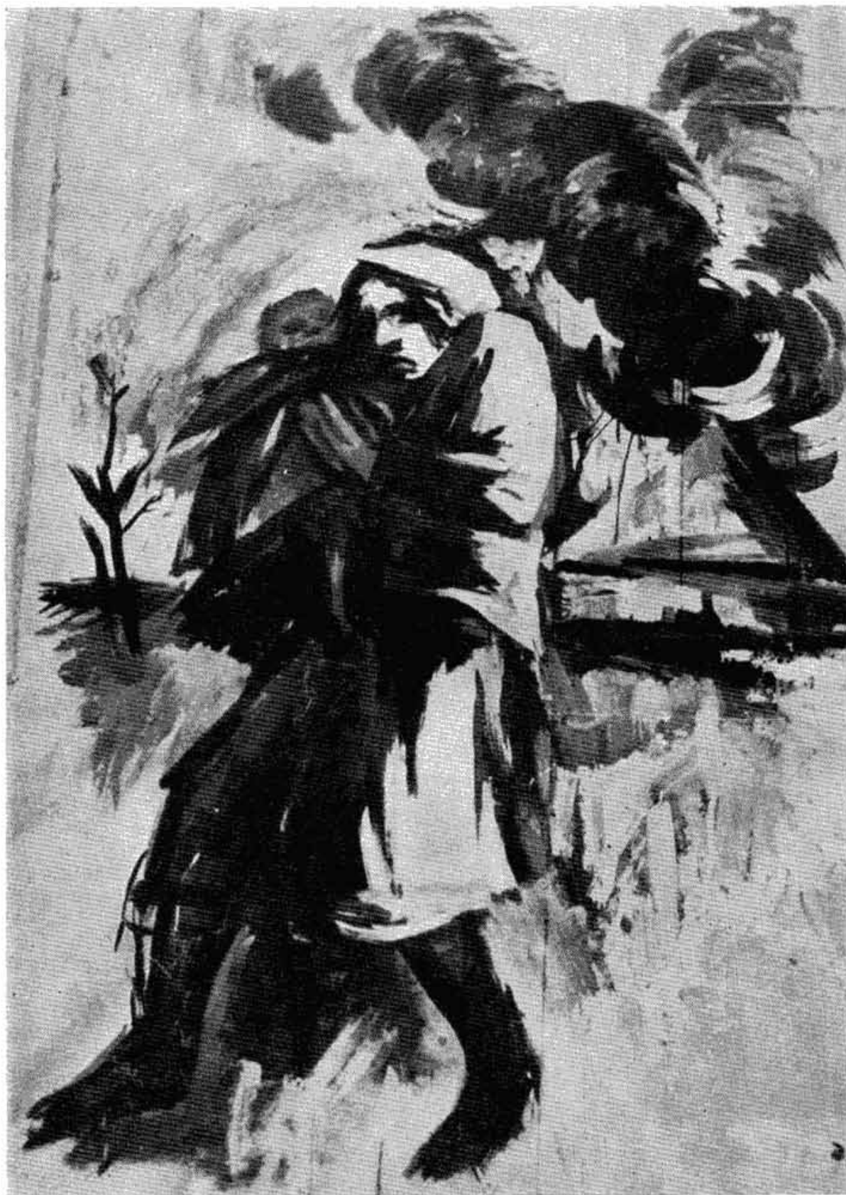
Сл. 1 — „Мајка“. Гваш. Рад Пиве Караматијевића.