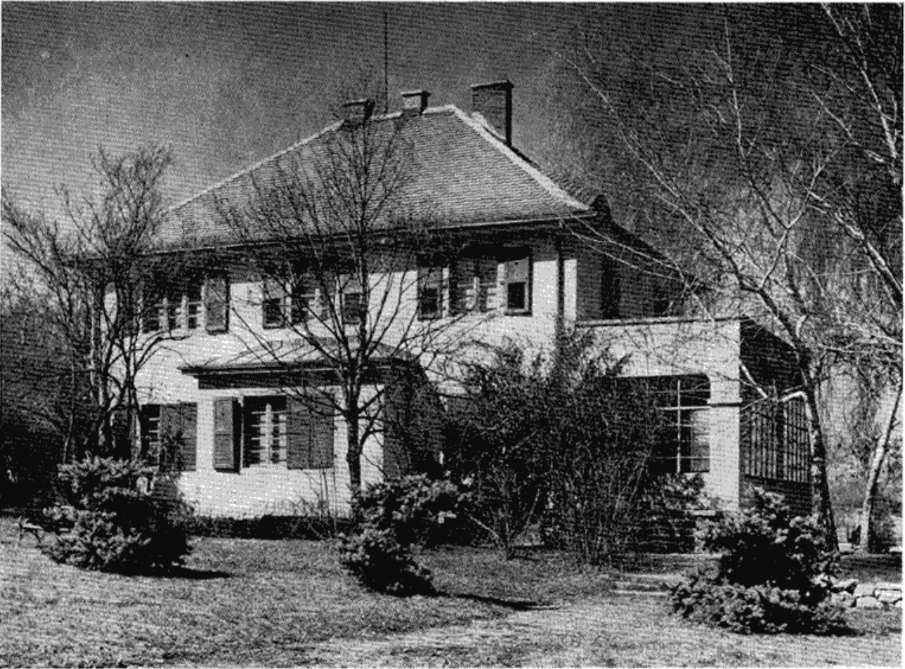
Сл. 1 — Кућа у Ботићевој улици. Данас Музеј 5 јула.