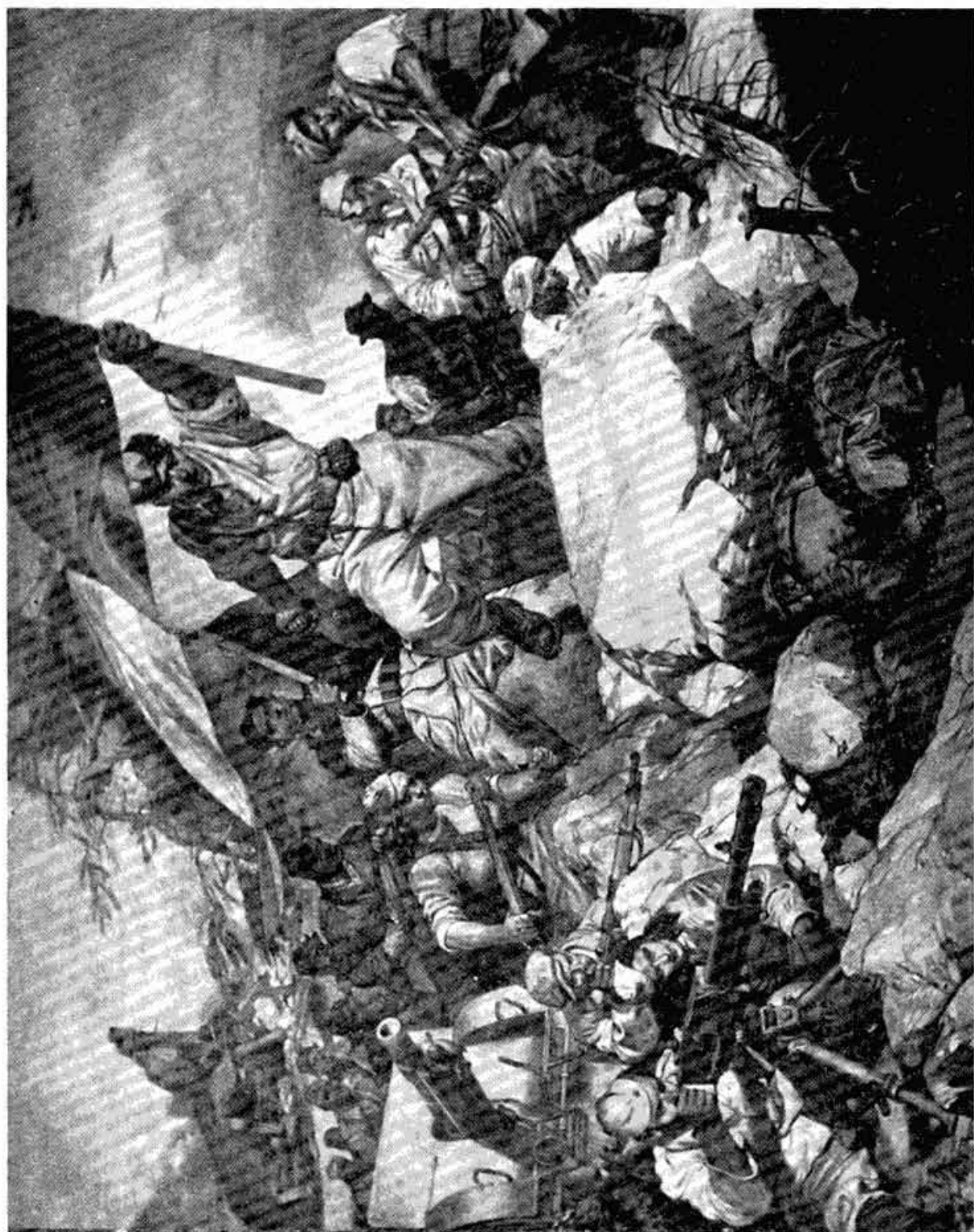
Славко Пенгов: Устанак. — Slavko Penkov: Soulèvement.