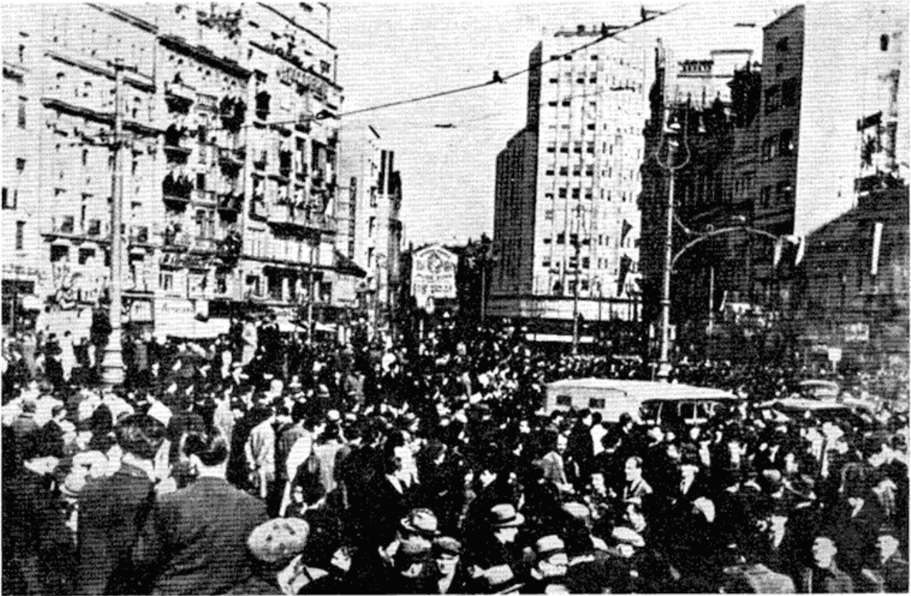
Сл. 1 — Теразије на дан 27 марта 1941 године.

је одржан митинг, на коме су говорили Светозар Вукмановић-Темпо и Владо Поповић. Одатле се поворка упутила у улицу Јована Ристића, где се налазило совјетско посланство. Пред зградом посланства масе су тражиле да им говоре совјетски људи, узвикивале паролe „Живео савез са Совјетском Русијом“, „Москва—Београд“ итд. Али се са прозора зграде нико није појављивао, ролетне на прозорима су биле спуштене. Људи у совјетском посланству, спроводећи Стаљинову политику незамерања Хитлеру, нису смели да поздраве оне који су били устали у отворену борбу са фашистима.