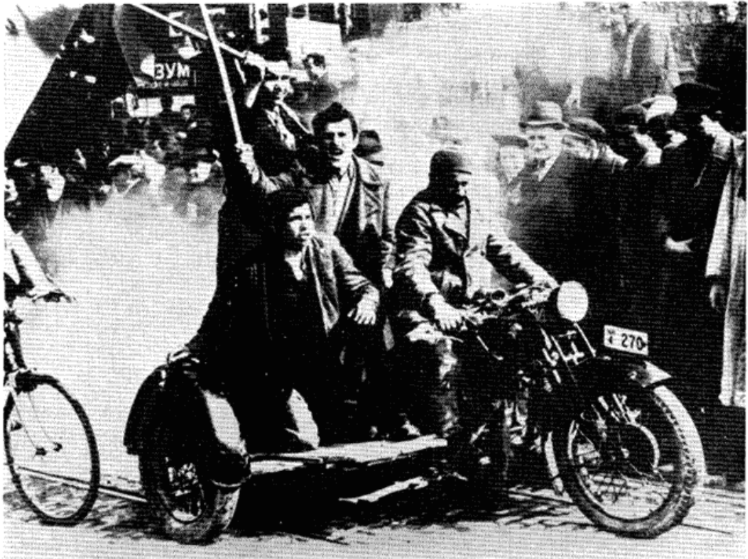
Сл. 3 — Са манифестација у Београду 27 марта 1941 године.

у својим правим намерама. Она је одмах окренула леђа народу. Не могавши да добије ефикасну помоћ код Англоамериканаца, она се била оријентисала да не раскида пакт са Хитлером, а да би то спровела у живот, предузела је све мере да спречи свако даље антифашистичко иступање маса. Зато је она примила помоћ старе режимске полиције и жандармерије и уз помоћ војске спречила одржавање митинга на дан 28 марта.