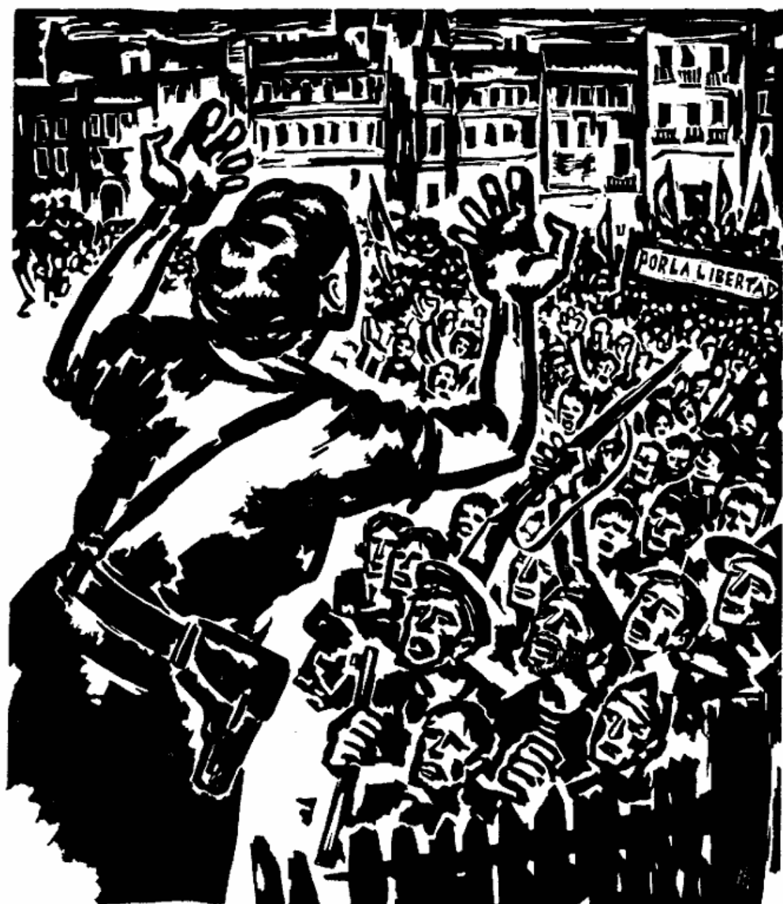
Ђорђе Андрејевић-Кун: Шпански народ у борби за слободу. Djordje Andrejević-Kun: Le peuple espagnol lutte pour sa liberté.