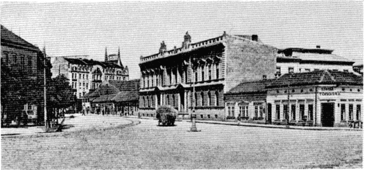
Сл. 2 — Бивши Окружни суд у Београду звани „Сељачки суд“ у Александровој улици (данас Булевар Револуције). Зграда срушена ради уређења Трга Маркса и Енгелса.

ри у вези с тим говорио јетко и оштро, критикујући руковођење споља, из иностранства.