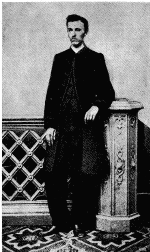
Сл. 1 — Светозар Марковић као студент.

вршена над народима. Светозар Марковић је свим својим срцем, целим својим бићем био уз париске побуњенике. Објаснио је србијанским читаоцима праведне узроке њихове побуне: „Онај који је радио најфинију свилу и кадифу није имао ни честите кошуље; онај што је зидао најлепше палате, чуда од уметности зидарске, није имао куд ни главу да склони; онај што је радећи у многобројним фабрикама стварао сва блага образованог света није имао да се честито наједе хлеба...“ Објаснио је србијанским читаоцима и улогу Интернационале. Прозрео је методе европске реакције у фалсификовању чињеница, у употреби најопскурнијих средстава помоћу којих су сејане лажи и обмане о Париској комуни. Ласалову изреку: