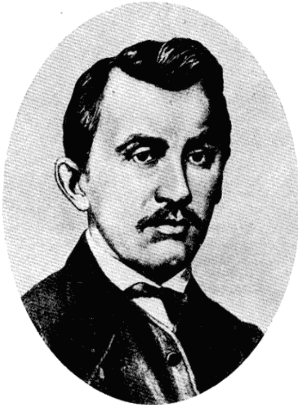
Сл. 2 — Светозар Марковић после студија.

у Паризу изазвала је код нас чудновате појаве. Свуда вичу писмено и усмено на неко страшило „комунизам“, а не знају ни сами шта је то. Чућете често у кафани, на улици или шеталишту: „Шта, зар ја стекао, а он — лењштина, који ништа нема и ништа не ради, да дође па да дели са мном? Ја сам радио и