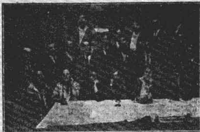
Штрајкашки Одбор Трикотаже.

и случаја јасно је као дан, иш) средина налазе Алени, и повремености иду у крај- рејући средства. Ово неје идијација, ово је најполнији иши злочин, који може доћи иште до крајности продане На своје савез врлине прена руговима у Савезу и Савезу ва повремена душа није у да оштећу тежину свога остуника и последица, које ко кино тем другогласно тако ишту. После овога случаја, до крајности бити обавршен, е злочинице морало оправда- и и ишћити из своје сре-