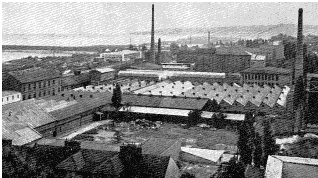
Сл. 1 — Текстилна индустрија „Београд“, улица 29 новембра бр. 109.

плаћивало се 50 динара, док је тај материјал фабричку управу стајао свега 20 до 50 пара. Дакле, зарада на радницима код отпада износила је 250 на сто од цене коштања (25.000 до 10.000%). Поред тога, порез на надницу такође је наплаћиван противно законским одредбама, јер уместо да се узме 3,35 динара, одбијало се 4,34%. Болесни радници су после 2 до 3 дана боловања добијали отказ — да се боље лече! 7