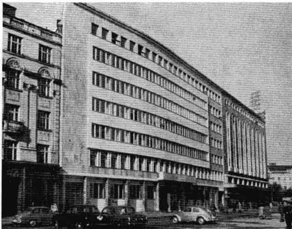
Сл. 7 — Нова зграда Народног одбора града Београда на Булевару Револуције.