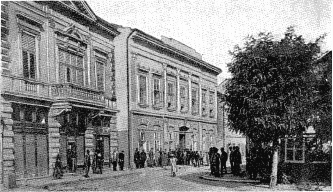
Сл. 3 — Зграда Народног одбора града Београда око деведесетих година прошлог века, пре реставрације.

су учествовале у изборима, већ и са читавим државним и тадашњим општинским апаратом, јер је читав тај апарат био стављен у покрет да би комунистима онемогућио успех на изборима. Зато је месна партиска управа морала бити веома будна у свим изборним радњама и посветити велику пажњу како агитационо-политичком раду, тако и организационој страни, па и техничким питањима избора.