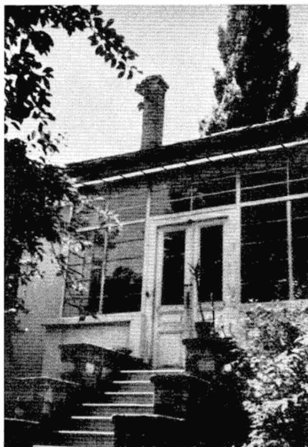
Сл. 11 — Нушићева кућа, Шекспирова 1, у којој је славни комедиограф провео последње дане живота.