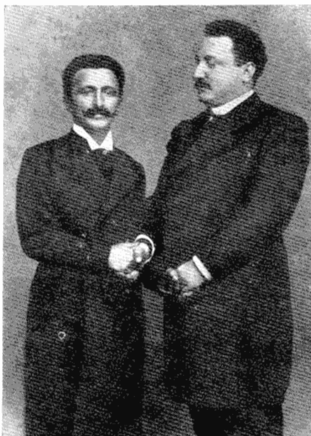
Сл. 6 — Нушић и чувени руски глумац Јужин Сумбатов.