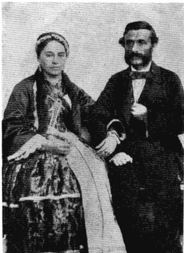
Сл. 1 — Венчана слика Нушићевих родитеља

имену прозвали Алко. Кад се оженио и добио порода, деца су га из милоште назвала Агом, што је прихваћено међу рођацима и пријатељима, те му је то присно име сачувано до смрти. Све то учинило је да се, у време кад је Нушић почео да стиче књижевни углед, радо шапутало о томе како је он „цинцарског“ порекла. Подметана му је нека врста расне злурадости према Србима и приписивано „туђој крви“ његово изношење на сцену појединих негативних особина наше средине.