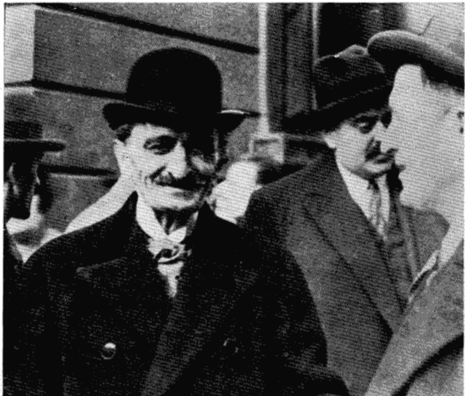
Сл. 9 — Нушић приликом отварања школе „Бранислав Нушић“ у Београду.

Ту теорију о Нушићевом карикирању ликова прихватили су и неки данашњи млађи позоришни теоретичари. Један од њих казује: „Нушићеви ликови су карикирани, али се на сцени понашају као у животу, спонтано и логично се уклапају у ситуацију и радњу“. Мало даље, додаје: „Нушић карикира и говор својих јунака“. Али већ у трећој реченици за овом даје констатацију: „Нушић речју васкрсава дах епохе, уз помоћ речи његове личности постају живе, речима нас он исмева, речима нас обасипа као опромним водопадом који се сурвава на нас, не да нам да одахнемо, ми грцамо у смеху, гушимо се, а речи стално навиру, куљају, нове, смелије, необузданије, смешније, бриткије, речи које стално слушамо у животу, али речи које тек ту,