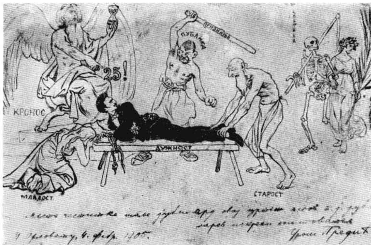
Сл. 7 — Честитка упућена Браниславу Нушићу на дан 25-годишњице књижевног рада. (Цртеж Уроша Предића).

налази извесну дубину, коју није запажао раније. Он је то потврдио и у своме напису Нушићев дух рекавши: „О Нушићу се данас мало шта може рећи у неколико реченица, а да то буде макар и у приближној размери са оним вредностима које ми данас осећамо да је овај изузетно даровити комедиограф имао. Што се више удаљујемо од Нушића и што нам се више кроз низ година открива колико је он незаменљив и како је изванредно тешко, да не кажемо немогућно, добити једног новог Нушића, — то се све више, разумљиво и природно, и све живље, осећа колико је то доиста био писац изузетних комедиографских капацитета“ 10 .