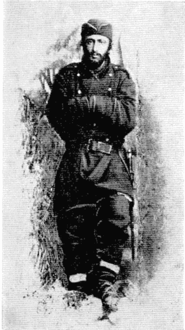
Сл. 2 — Нушић, као каплар, у време Српско-бугарског рата 1885 године.

Нушићева друга комедија из тога времена, Сумњиво лице , доказала је да се није преварио што је тако поступио.