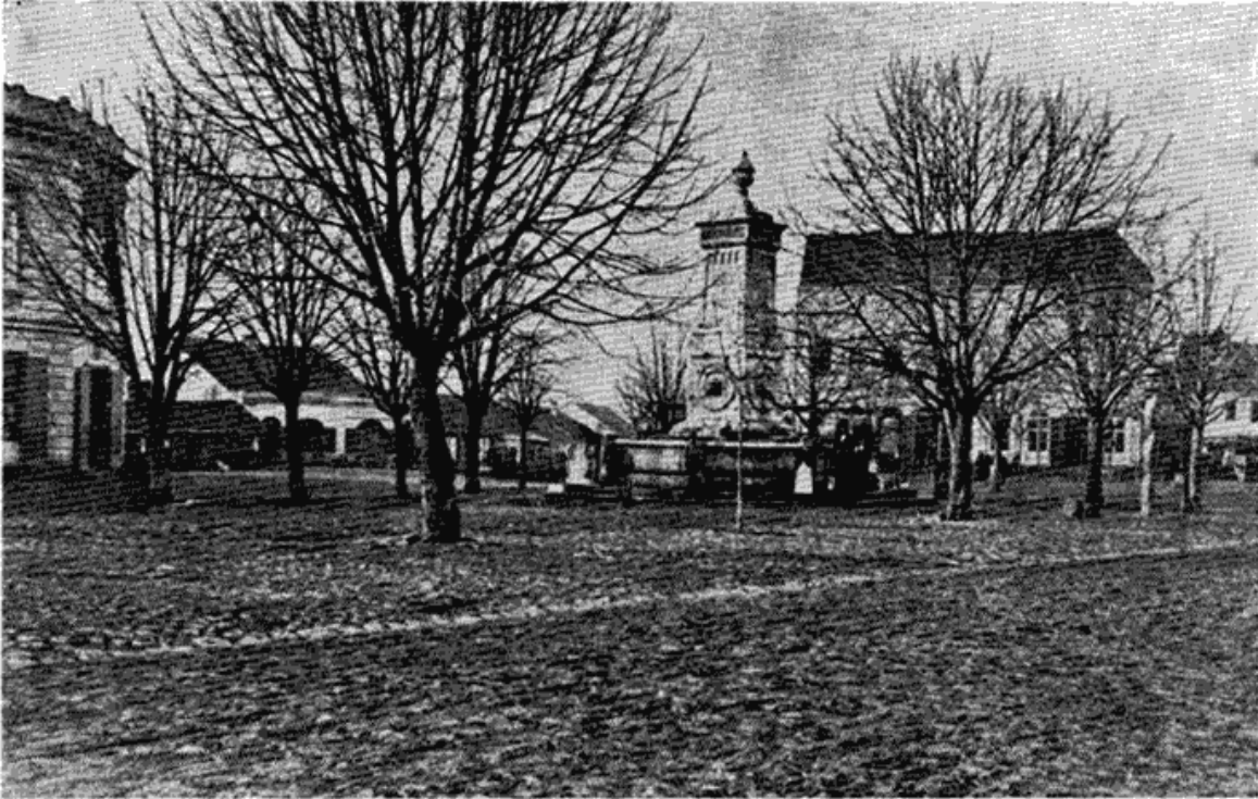
Сл. 2 — Теразије из 1876 године са Теразиским чесмом. Снимак руског фотографа Громана. (Из збирке Музеја града Београда).

када по времену грађења као и по конструкцији припада аустријском периоду. Неки сматрају, да је то због тога што је ту, на истом месту, био и раније бунар, који су Аустријанци вероватно само обновили. Евлија Челебија, турски путописац, пишући о Београду половином прошлог века, каже: „У томе Нарину (западни део Горњег града) има један бунар који је дубок педесет лаката. Он је каналом спојен са Савом“. 5 Да ли је овај бунар римског, аустријског или другог порекла, на овом месту није од значаја. Много је важнија чињеница да је и Римски бунар у време оскудице водом у Београду напајао читаву посаду тврђаве и као такав одиграо веома важну улогу. Данас је он један од многих историских споменика.