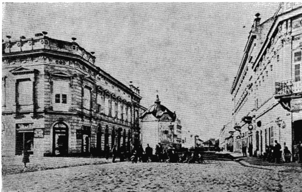
Сл. 3 — Делиска чесма испред зграде Николе Спасића у Кнез Михајловој улици.

употребљавали и бунарску. Евлија Челебија наводи: „Кућних бунарева има 11.000. У њима је вода нешто мало слана“. 8 Како је Челебија дошао до ове цифре није познато, али је мало вероватно да она одговара истини, пошто су бунари копани изван вароши, а у самој вароши готово их није ни било.