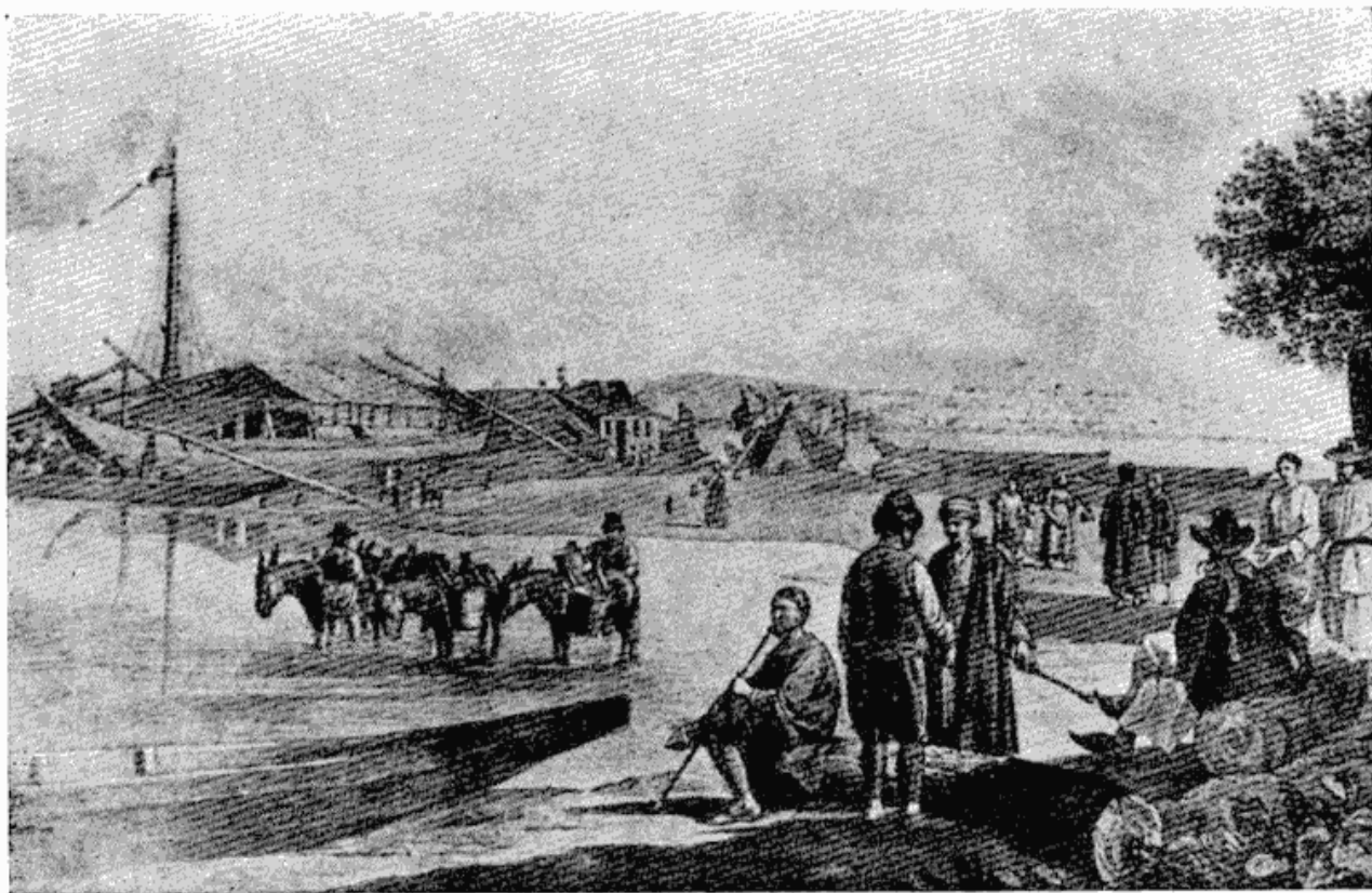
Сл. 4 — Поглед на Београд са земунске стране. Гравира. Рад Ј. Алта, 1820 године. (Из збирке Музеја града Београда).

У близини Сака-чесме, на средини некадашње Велике пијаце, данашњег Универзитетског парка, налазила се Пијачна чесма, која је добијала воду од Делиске чесме. Нешто ниже, испред Доситејевог и Вуковог музеја, постојала је Мала чесма. Поред ових било је још неколико других: једна у Савамали, у данашњој Поп Лукиној улици — Тоскина чесма, тако названа што је била испред куће познатог београдског трговца Тоске. Даље, једна у близини Саборне цркве, па у близини данашње Палилулске школе, на раскршћу Таковске и Далматинске улице, испред Ботаничке баште. Постојала је и једна већа чесма у старој синагоги, у Јеврејској мали, и друга у горњем делу вароши, у порти старе цркве Св. Марка, којом се дуго служило. Од ових чесама из прошлог века до данас је остала само Терзиска; она је подигнута 1860 године,