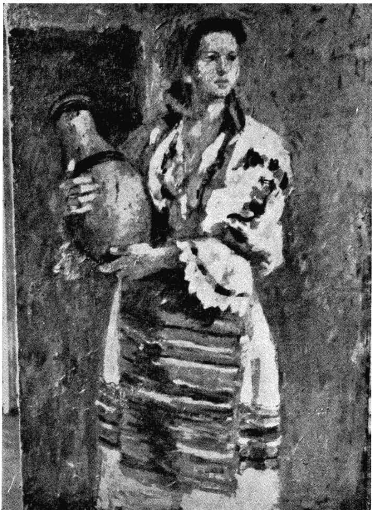
Ђорђе Андрејевић-Кун: Водоноша. — Djordje Andrejević-Kun: Potreuse d'eau.