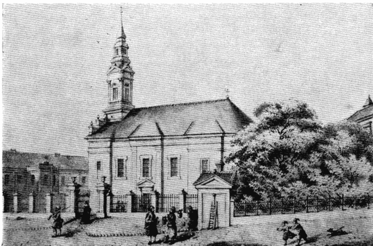
Сл. 1 — Варошка црква у Београду — литографија у боји, рад Квицова 1856 године.

српска кафана... 10 Јасно нам је да је у питању Београдска црква. Тврдо или солидно зидано здање, ниуком случају не може бити грађевина од брвана, за коју се обично каже да је од трошне грађе, или од слабог материјала, што овде није случај.