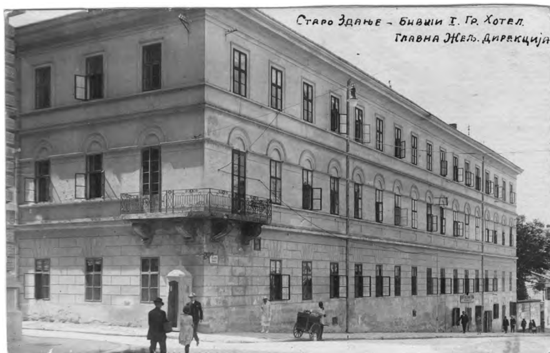
Слика 1. Хотел „Код јелена“ или „Старо здање“, фотографија непознатог аутора (МГБ, Ур. 418) Figure 1 Hotel Kod Jelena or Staro Zdanje, photograph by an anonymous author (BCM, Ur. 418)

Наредне, 1848. године, велики успех доживела је представа Ђорђа Малетића Ајо-џеоза бесмртном Карађорђу . 7 Позоришна сала је имала галерију са два реда седишта и местима за стајање, али није имала ложе јер није била наменски грађена, већ је адаптирана за ове потребе. Рад позоришта је прекинут након подметнутог пожара 1849. године. 8 У истој сали одржавани су музички концерти, али и друге представе на којима су наступали разни свирачи, певачице и вештаци. 9 Чувени су и први „отмени“ балови које је организовао закупац Хариш. Познат је и