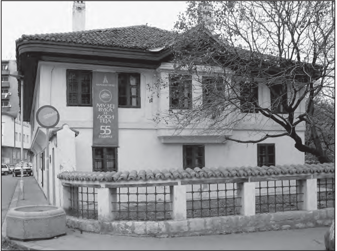
Сл. 5. Данашњи изглед Музеја Вука и Доситеја Fig. 5. Vuk and Dositej Museum today

Чести посетиоци су и организоване групе студената друштвених наука, за које се такође припремају посебна предавања, прилагођена областима којима се баве.