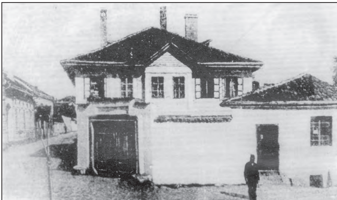
Сл. 2. Најстарији сачувани снимак зграде Музеја из 1892. године Fig. 2. The oldest preserved photograph of the Museum, 1892