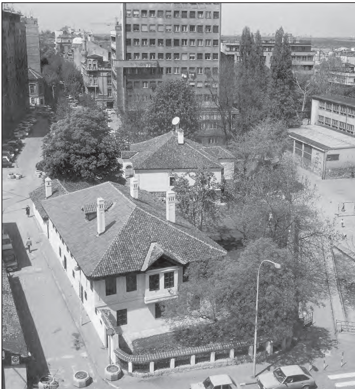
Сл. 1. Зграда Музеја Вука и Доситеја данас Fig. 1. Vuk and Dositej Museum building today

отворио за публику четири своја одељења, а у оквиру Историјског се нашла и Вукова заоставштина. Нешто касније, спајањем Хисториско-уметничког музеја и Музеја савремене уметности, основан је Музеј кнеза Павла и Вукови предмети су пренесени у његове витрине.