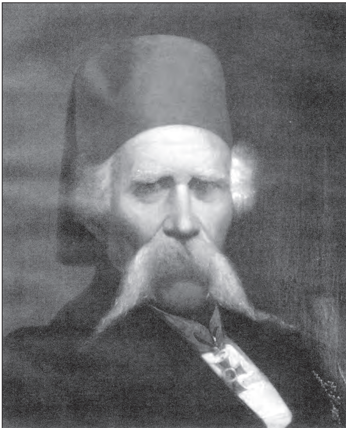
Сл. 4. Аксентије Мародић, Вук Караџић Fig. 4 Aksentije Marodić, Vuk Karadžić

су хронолошки, на приступачан начин, описани његов живот и рад, поставка садржи прва издања Доситејевих дела, портрете