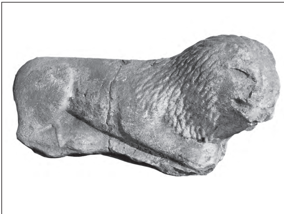
Сл. 3. Скулптура лава, налаз из Пожеге Fig. 3 Stone lion from Požega

митреја у селу Врањани код Ужица, у којем је нађена и једна скулптура лава, дозвољава да се претпоставка о повезаности фигура лавова са Митриним култом прихвати. 11 Тако би једна од могућих употребних функција слободних скулптура лавова била њихово коришћење, као декоративно-симболичних елемената, у светилиштима Митриног култа, или на прилазима њима. Осим тога, слободне скулптуре лавова су могле да служе као конкретно гробно обележје или као декоративни елементи на прилазима гробницама, или пак самих гробница.