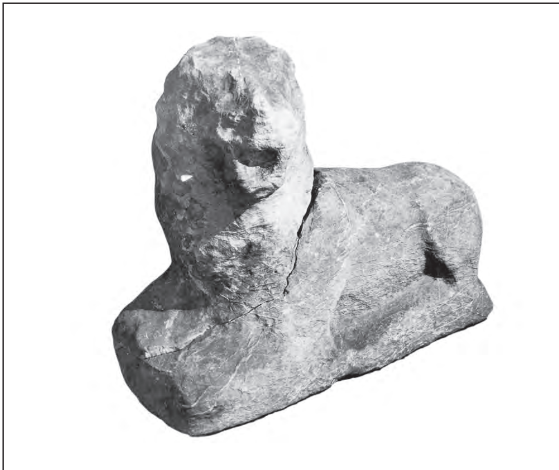
Сл. 2. Скулптура лава, налаз из Пожеге Fig. 2 Stone lion from Požega

њима, композиционе целине са додатним декоративним елементом упућују, ако не на хронолошки, онда бар на идејно-религиозни елемент, па је утолико лакше претпоставити њихову спону са одређеним култом. Обично се ради о глави Медузе, овна или бика, што