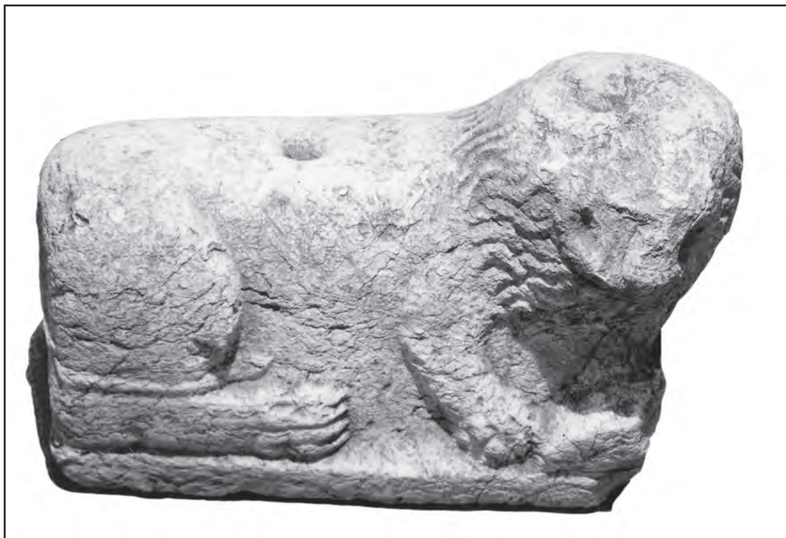
Сл. 6. Скулптура лава, налаз ис Врањана Fig. 6 Stone lion from Vranjane

то да је у његовом становништву констатован оријентални елемент, за који се сматра да није био претежно цивилног карактера. 24 Ово се уклапа и у раније претпоставке, нарочито оне које се односе на подручје данашњег Пожаревца, да је могуће да је војска имала главну улогу у преношењу идеја које се тичу продора материјала и религиозно-филозофске концепције коју он носи са собом. 25 Уочљиво је да се слободне камене скулптуре лавова са простора Пожаревца и ужичко-пожешког краја, највероватније, могу узети за култ Митре, који је током времена на подручју ужичко-пожешког краја постао саставни део јединствене религиозно-