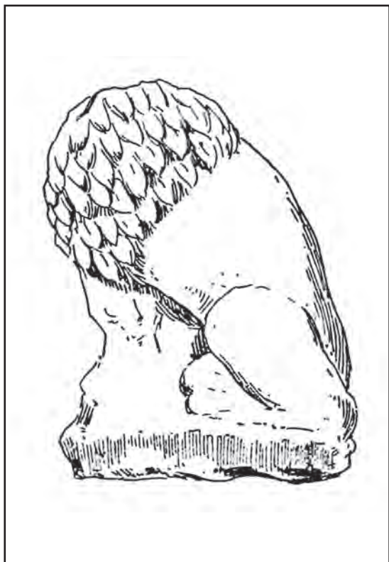
Сл. 4. Скулптура лава, налаз из Пљеваља Fig. 4 Stone lion from Pljevlja

извесни аутори по том питању скептични, па их и даље одређују као декоративне скулптуре гробних целина. 12