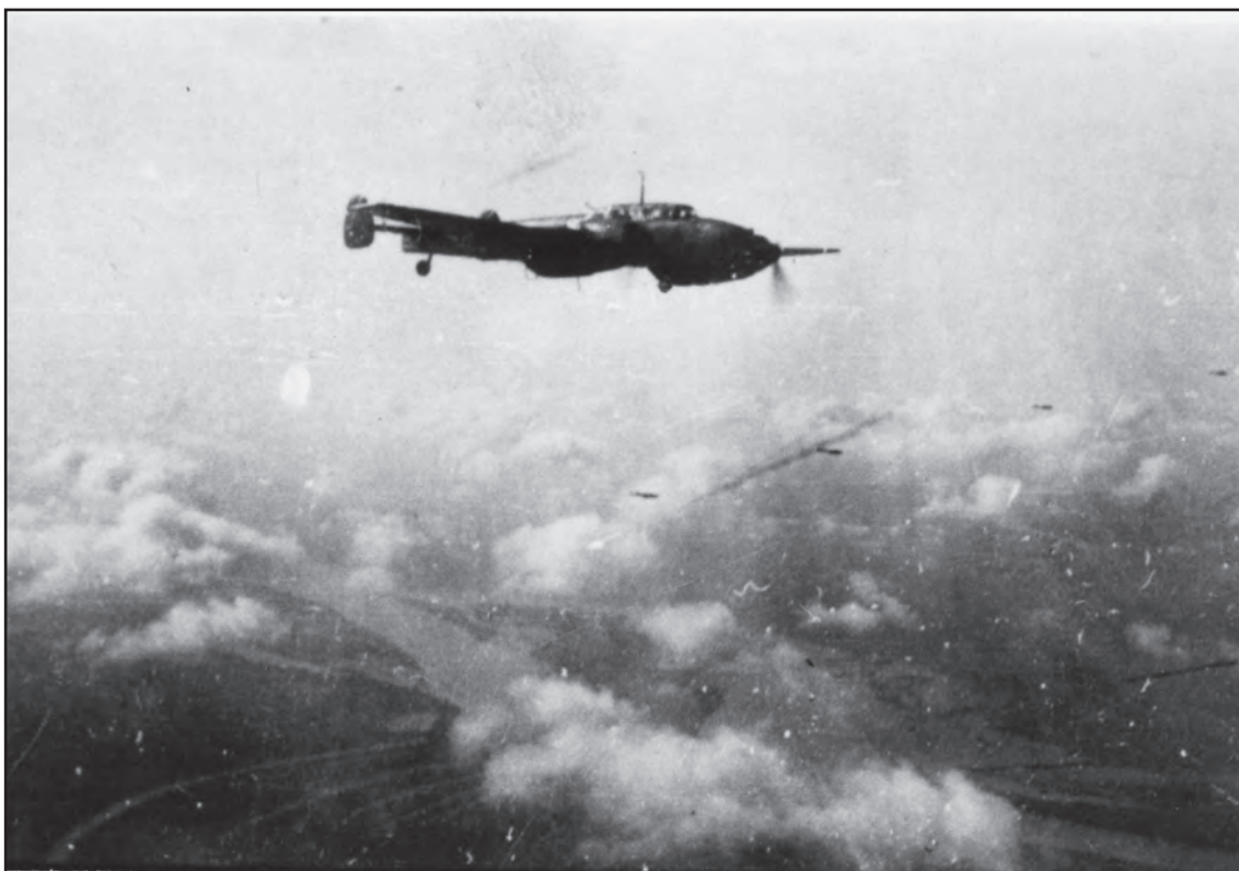
Сл. 7. Аутентични снимак Месершмита из 20. ловачко-бомбардерског пука у лету ка Београду. Фотографија је из албума заробљеног немачког авијатичара, а албум је чуван у Музеју револуције у Љубљани

Fig. 7 The original photograph of the Messerschmith from the Twentieth fighter-bomber airforce wing, flying towards Belgrade. The photograph was taken from the album of the captured German pilot, and the album was kept in the Museum of the Revolution in Ljubljana