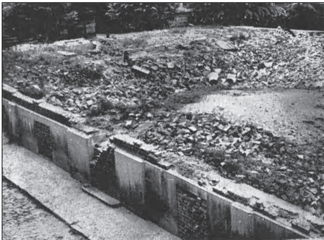
Сл. 9. Згариште Народне библиотеке Србије на Косанчићевом венцу Fig. 9 The remains of the National library of Serbia in Kosančićev Venac Street