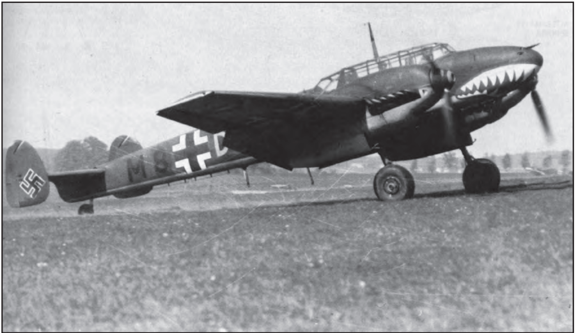
Сл. 6. Разарач Месершмит (Me-110). Брзина 565 km на сат, долет 1.200 km, носивост 500 kg бомби Fig. 6 Destroyer Messerschmith (Me-110). Speed 565 km/h, range 1,200 km, capacity 500 kg of bombs

94 бомбардера и предвече са 99 Штука“. 9 Ловачку пратњу је пружало 120 ловаца Me-109, док је око 30 Me-110 тукло аеродроме и друге циљеве у Београду, Новом Саду и Панчеву. Јединице двомоторних бомбардера су у току дана извршиле по два напада, док су јединице „штука“, захваљујући близини аеродрома у Румунији, успеле да три пута надлете Београд. Циљ ноћних напада, које су изводили појединачни авиони, или у мањим групама, а трајали су од 22.30 до 24 сата, 6. априла, и од 03.30 сати, 7. априла, била је шира зона центра града, јако осветљена многобројним пожарима, што су немачки штабови и предвидели. Са