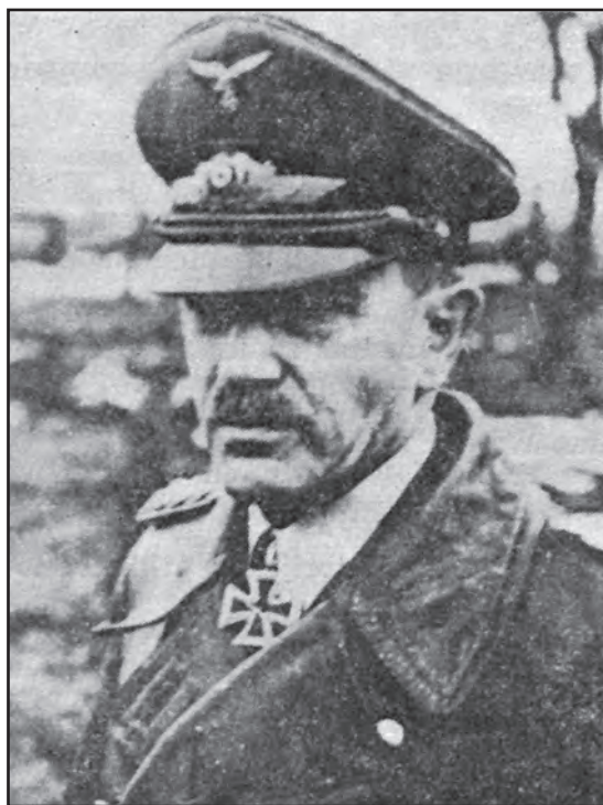
Сл. 2. Генерал-пуковник немачке авијације Александар Лер Fig. 2 Lieutenant General of the German airforce Alexander Löhr

За офанзиву на Југославију, силе осовине су у Аустрији, Мађарској, Румунији, Бугарској и Италији прикупиле укупно 2.144 авиона, од којих су 1.470 били немачки, а 674 италијански. 6 Већ од 29. марта, немачки бомбардерски и ловачки пукови, који су до тада учествовали у ваздушним ударима на Енглеску и стекли велико борбено искуство, пребацивани су из Француске на аеродроме у Аустрији, Мађарској и Румунији, на којима су вршене припреме за нову „ваздушну кампању“. Чим су завршени планови за напад, командант 4. ваздушне армије (Luftflotte 4), генерал авијације Александар Лер, издао је 31. марта 1941. наређење својим јединицама, које је носило шифровани назив