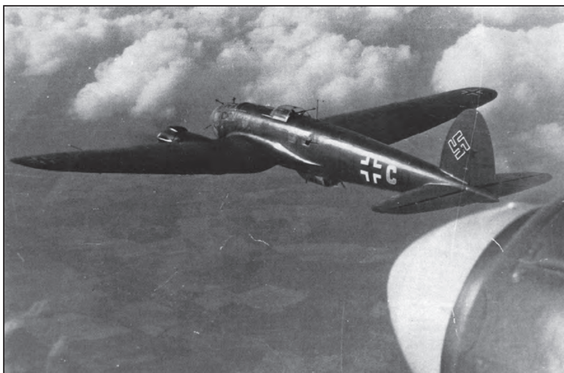
Сл. 4. Бомбардер Хенкел (He-111P) из II групе дивизије KG-4. Брзина 398 km на сат, долет 2.400 km, носивост 2.000 kg бомби