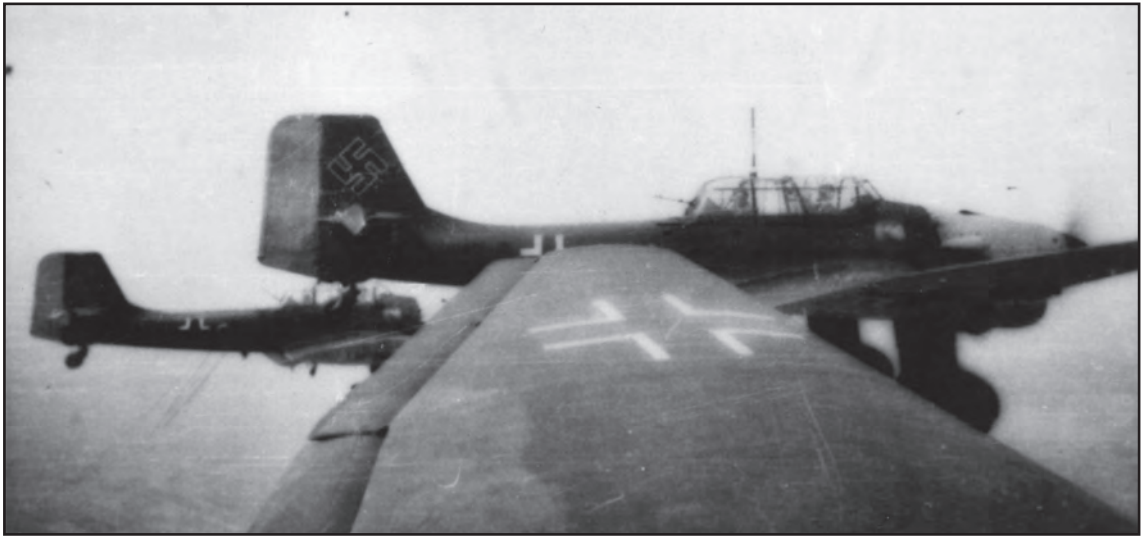
Сл. 8. Аутентични снимак обрушавајућег бомбардера Јункерс (Ју-87), „штукe“, из састава дивизије КГ-77 у лету ка Београду. Фотографија је из истог албума као и претходна. Долет 790 km, носивост 1.000 kg бомби