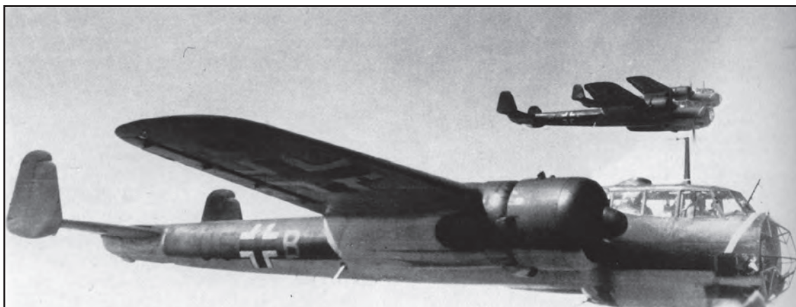
Сл. 3. Бомбардер Дорније (Do-17Z) из састава III пука дивизије KG-2 која је учествовала у нападу на Београд. Брзина 410 km на сат, долет 1.500 km, носивост 1.000 kg бомби