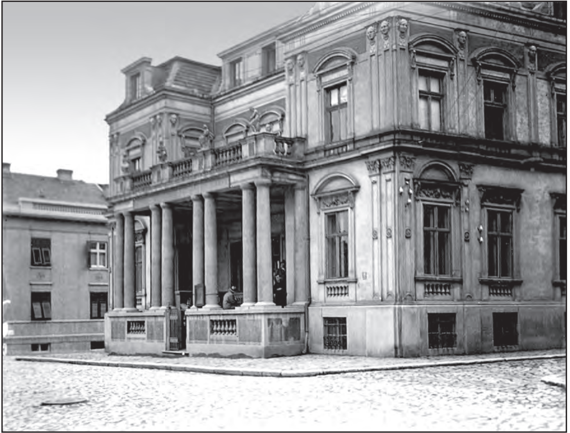
Сл. 1. Здање Народне библиотеке Србије на Косанчићевом венцу Fig. 1 The building of the National Library of Serbia in Kosančićev Venac Street

окупатора био врло неповољан закључак. Имајући у виду тадашње околности и реалан страх од немачке одмазде, суд чланова комисије се може оценити као мудар и патриотски.