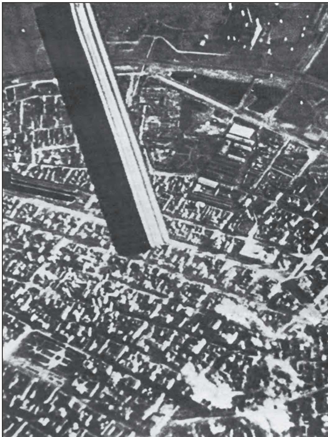
Сл. 10. Снимак Београда за време напада 6. априла који је снимила посада немачког бомбардера Ју-88 из 51. бомбардерског пука. У првом плану је контејнер са запаљивим бомбама којима је обасут град

Fig. 10 A photograph of Belgrade during air raid of April 6th, made by the crew of the German bomber Ju-88, from the fifty-first airforce wing of bombardment aviation. In the foreground, a container of incendiary bombs, which the city was showered with