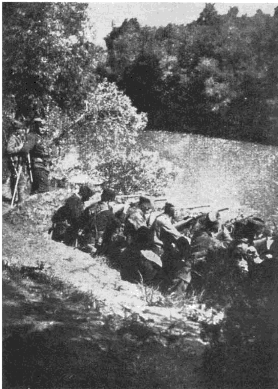
Сл. 7 — Војници и комите бране Аду Циганлију код Београда

пуцањем у месо. Пошто је добијен извештај да се једна нападачева колона упутила од Малог Калемегдана Улицом Страхињића Бана, добровољци су у трку избили на Зерјек, ту пред радњом „Пеливана“ подигли тврду барикаду и дочекали непријатеља, који је у колони ишао као на егзицириште. Ускоро, пошто је већ пао мрак, добро-