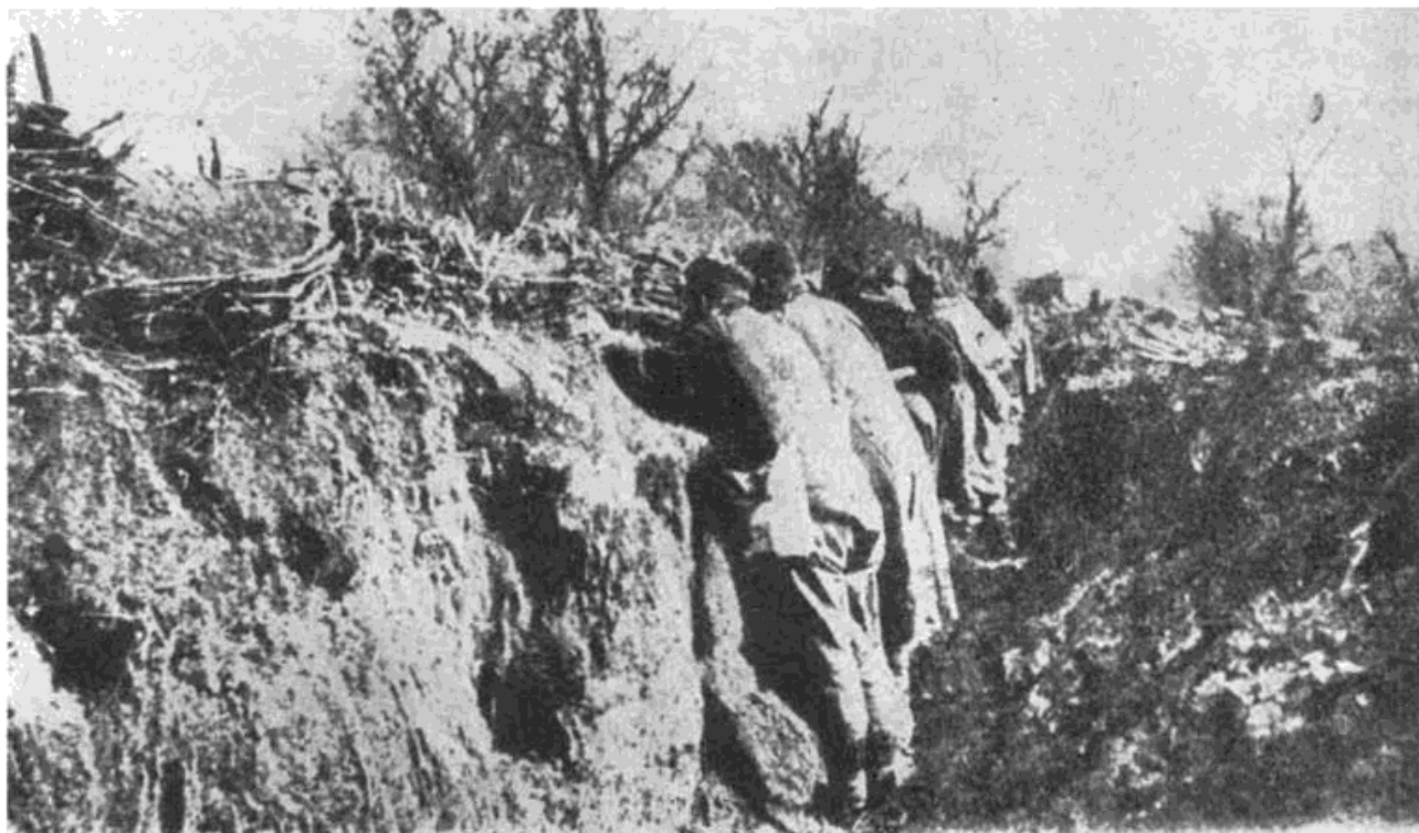
Сл. 2 — Ада Стефанац: Ровови (Из књиге Р. А. Рајца)

лови у нереду повукли чак до Батајнице. 19