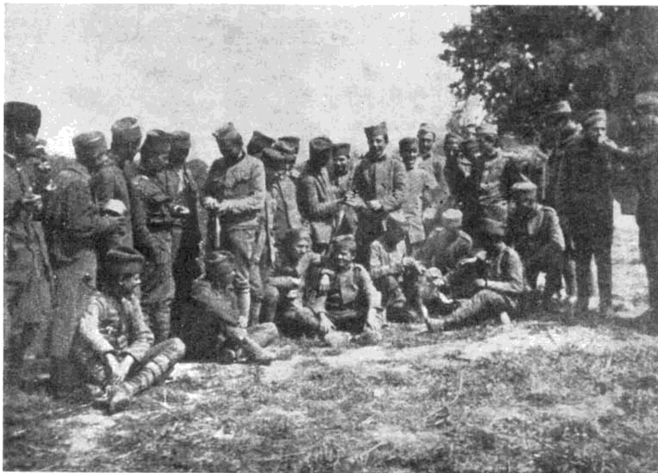
Сл. 1 — Ада Циганлија: Млади добровољци (Из књиге: Р. А. Рајса: Шта сам видео и проживео )