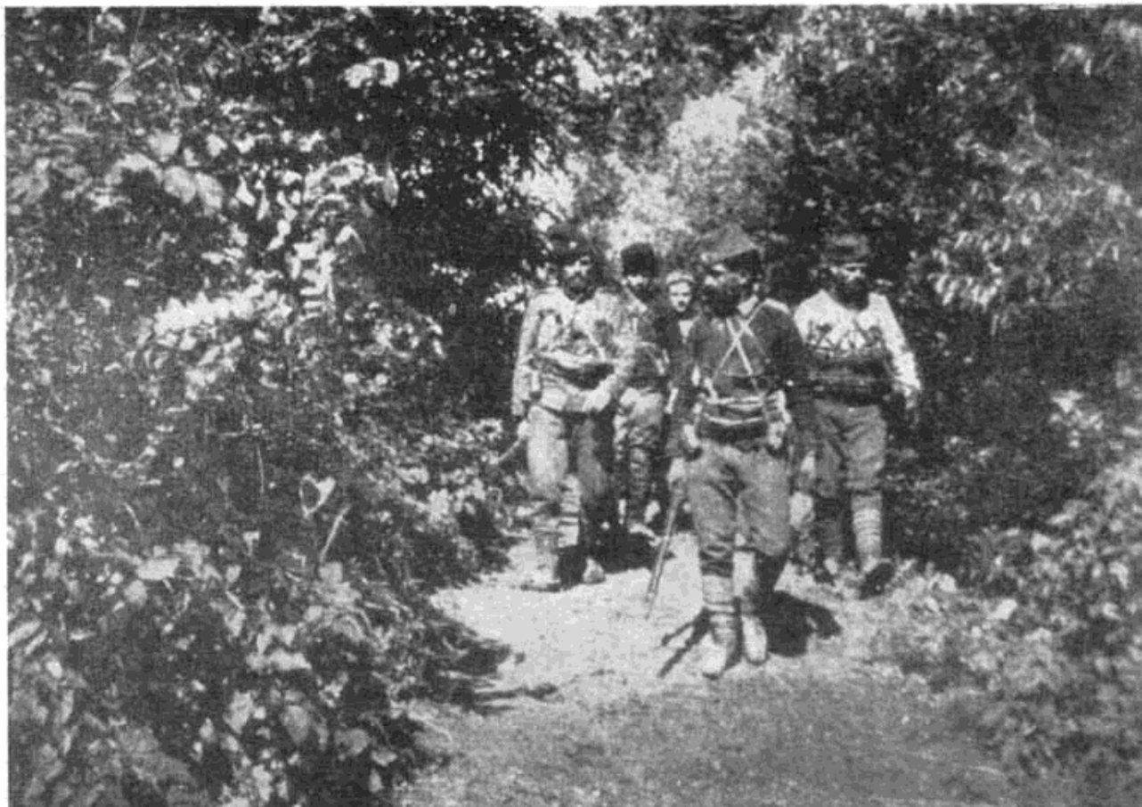
Сл. 4 — Бавоље острво: Извидница четника (Из књиге Р. А. Рајса)