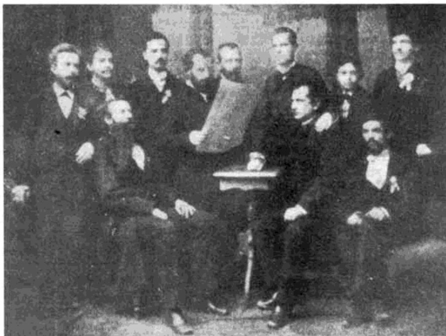
Сл. 2 — Управа Дружине са редитељем Народног позоришта и групом типографа

омасови, лежи у чињеници што је она у својој основи још увек била само хуманитарна организација и што се, као таква, није упуштала у борбу за заштиту права радника. Међутим, радници су све више осећали потребу, не само за материјалном потпором у болести и смрти, већ и за заштитом од учестане самовоље послодаваца.