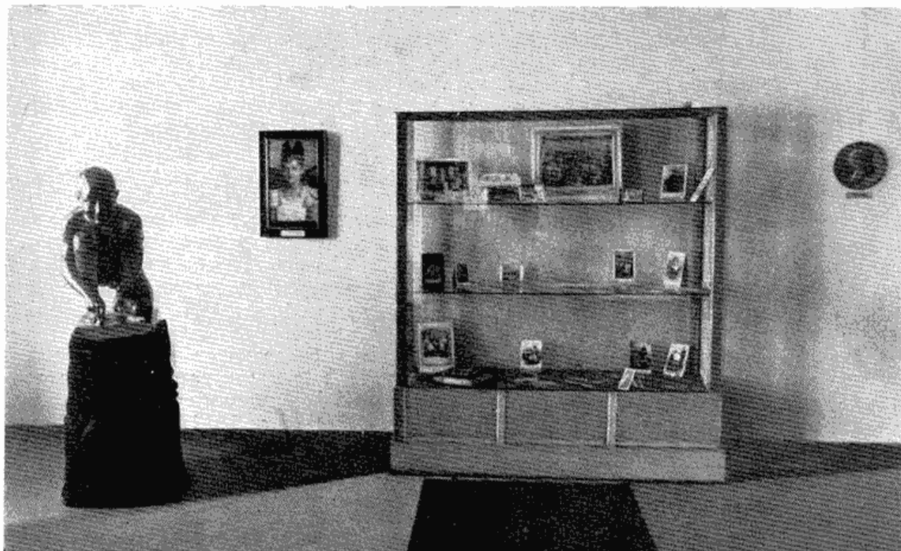
Сл. 1 — Једна витрина са дечјим фотографијама

зреле уметничке личности, богатство палете пуних златасто мрких тонова, виртуозно сликарски остварене материјализације предмета и психолошке уверљивости ликова.