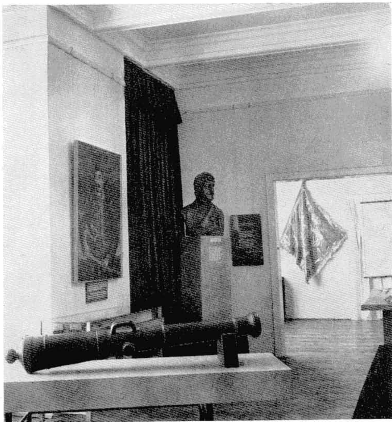
Сл. 3 — Централна соба на изложби Првог српског устанка у Музеју града Београда, поводом прославе 150-годишњице ослобођења Београда од Турака

Локалну ноту и истицање Београда у догађајима тога времена подвлаче макета куле Небојше и споменута композиција Дахије која је надахнута народном песмом Почетак буне против дахија , а нарочито стиховима који су исписани и постављени поред те композиције и