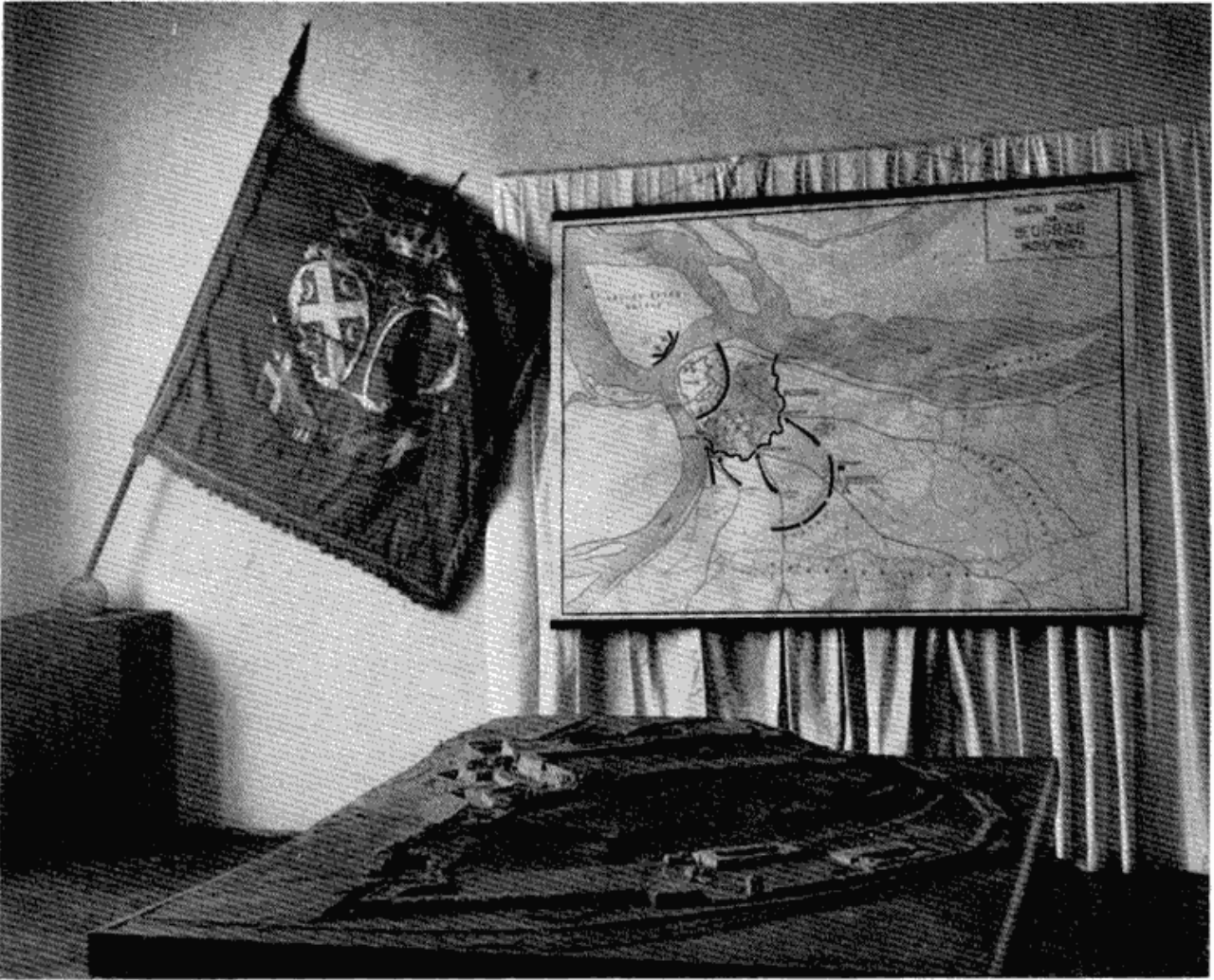
Сл. 4 — Са изложбе Првог српског устанка у Музеју града Београда, поводом прославе 150-годишњице ослобођења Београда од Турака — застава из Првог српског устанка, рељеф Београда и план напада на Београд

Одмах после ослобођења вароши Срби су ископали шанац између вароши и Калемегдана те су почели тући топовима и пушкама Горњи град. Турци се због тога склоне у Доњи град, који Срби почну тући са Ратног острва. Нашавши овлаш затворену Су (Водену) капију Срби уђу у Доњи град, те тако присиле Гушанца Алију да им га преда, а Гушанац са својим крџалијама отплови ка Видину. Тако је 27 децембра (8 јануара 1807) 1806 године цела београдска тврђава пала Србима у руке.