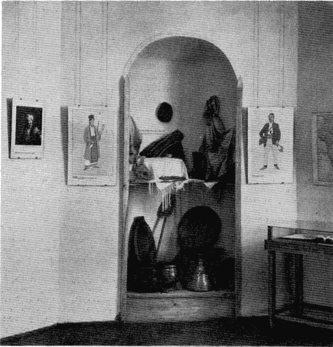
Сл. 1 — Прва соба на изложби Првог српског устанка у Музеју града Београда, поводом прославе 150-годишњице ослобођења Београда од Турака — ниша са етнографским објектима

су посетиоца са узроцима, током, суштином и главним карактеристикама револуционарне борбе српског народа почетком XIX века.