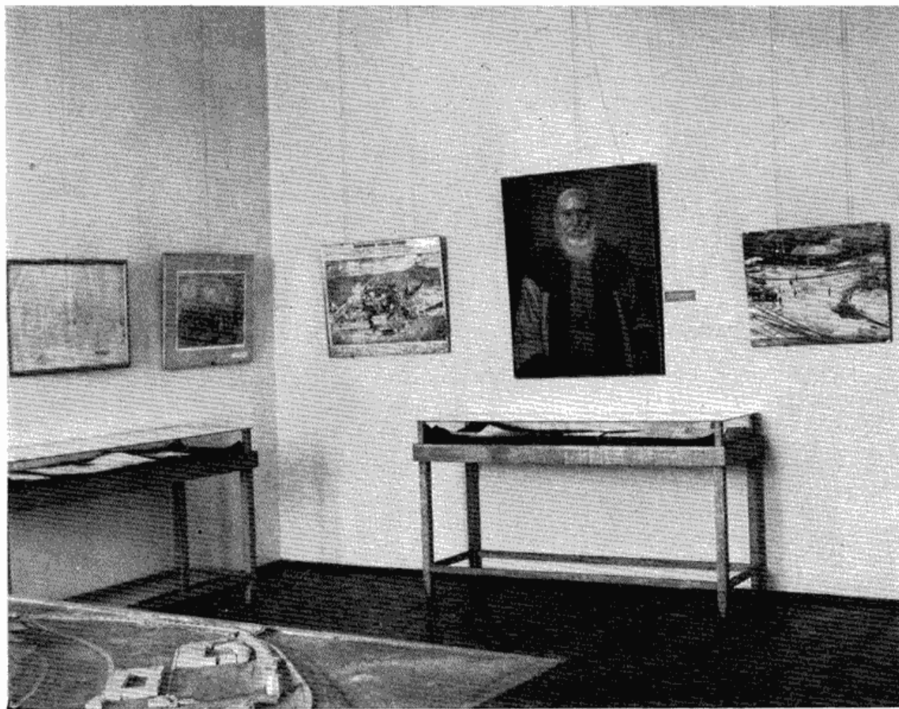
Сл. 5 — Са изложбе Првог српског устанка у Музеју града Београда, поводом прославе 150-годишњице ослобођења Београда од Турака — део документарног материјала

На тај моменат потсећа гледаоца један снимак куле Небојше, магацина и тополинице у Доњем граду, као и