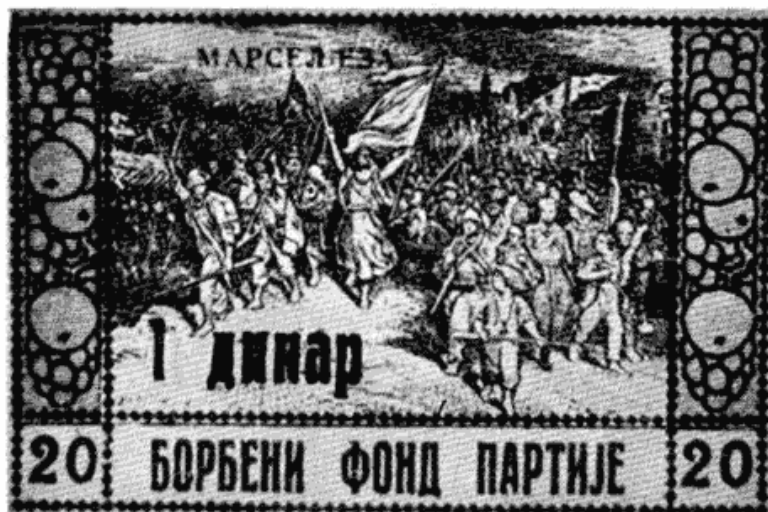
Сл. 15 — Фотокопија једне маркице Борбеног фонда Партије из тога времена

На овом пленуму донета је и значајна одлука о покретању акције за отва-