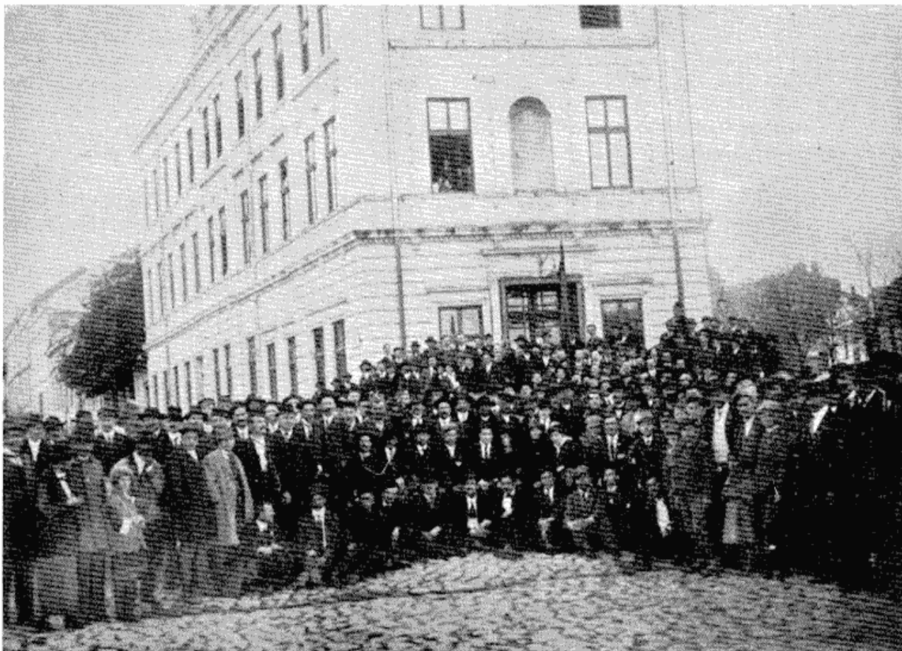
Сл. 8 — Делегати на Конгресу уједињења, 20—24 априла 1919 године, испред хотела „Славија“, чија је предња фасада порушена за време Другог светског рата. На том Конгресу је основана Социјалистичка радничка партија Југославије (комуниста)