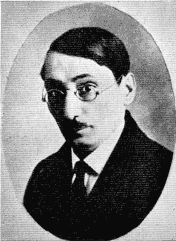
Сл. 11 — Моша Пијаде, истакнути руководи- лац пролетерског покрета Југославије, који је својим револуционарним радом у Комуни- стичкој партији Југославије делао од њеног оснивања. Фотоснимак из 1925 године

унесу у закон. 157 Од посебног је значаја што је са збора упућен апел пролетаријату целе Југославије да се следеће недеље, 25 маја, одрже протестни зборови у целој земљи и влади поднесе са тих зборових истоветна резолуција. 158