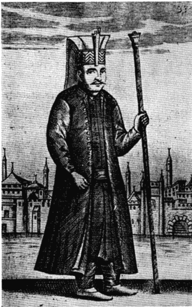
Сл. 5 — Турски јаничар у XVII веку, по Рикоу

мир, крцалије су се у Београду стално утврђивале. 123 Све капије на тврђави, сем код куле Небојше, и дању и ноћу биле су под кључем, а нарочита пажња била је обраћена централном барутном магацину у Горњем граду. 124 Делимично је то, по наредби Гушанца Алије, било учињено из подозривости према везиру Сулејман паши, кога су крцалије држале у већем запту но његовог претходника Бећир пашу. 125 Стране новине чак су