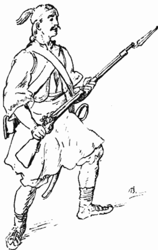
Сл. 3 — Српски војник у доба Устанка, по ба- крорезу Ц. Г. Х. Гајслера, цртеж Павла Васића

Аустриске Градачке новине ( Gratzer Zeitung ) јављале су чак и о видном ја-