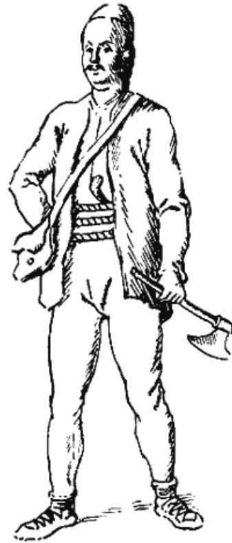
Сл. 2 — Српски сељак 1800 године, по бакро-резу Ц. Г. Х. Гајслера, цртеж Павла Васића

Под утиском свих ових пораза у опседнутом Београду помишљало се, не само у јерлиским круговима, на мирно