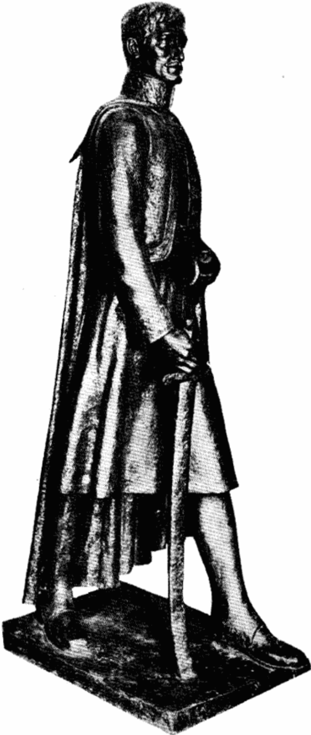
Сл. 1 — Карађорђе, рад Петра Палавичинија

ноје Главаш са одредом од пет до шест стотина људи, палећи ханове и убијајући Турке, пленећи дахиске читлуке, за десет дана одметнули су села и околине Раниловића, Дрлупе, Рогаче, Ду-