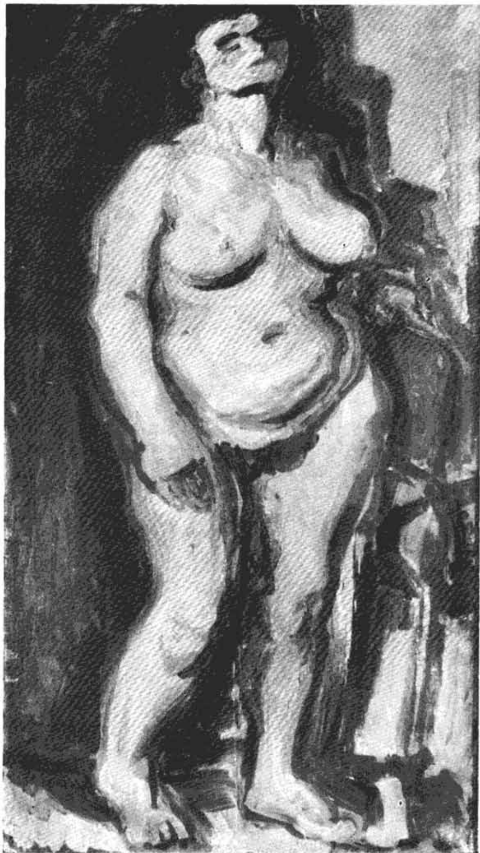
Сл. 9 — Зора Петровић: Акт (1954)