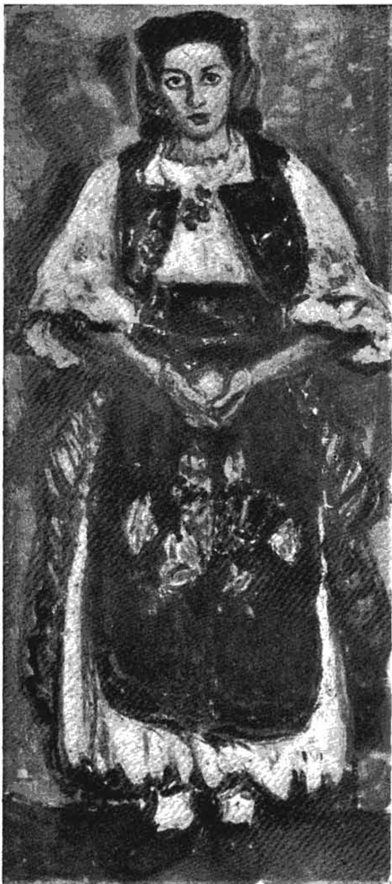
Сл. 4 — Зора Петровић: Девојка из околине Београда (1950 г.)