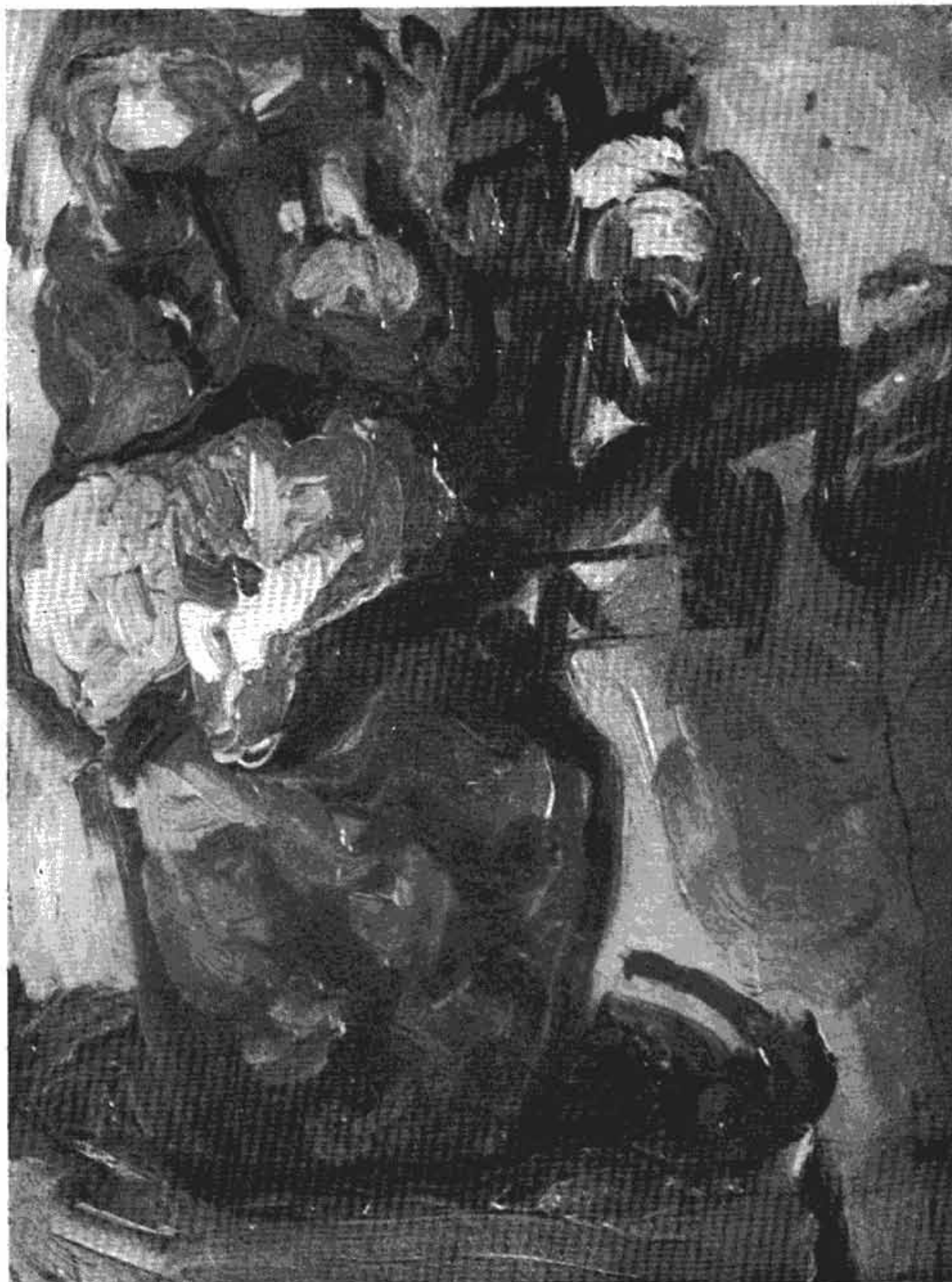
Сл. 6 — Зора Петровић: Цвеће (1953 г.)