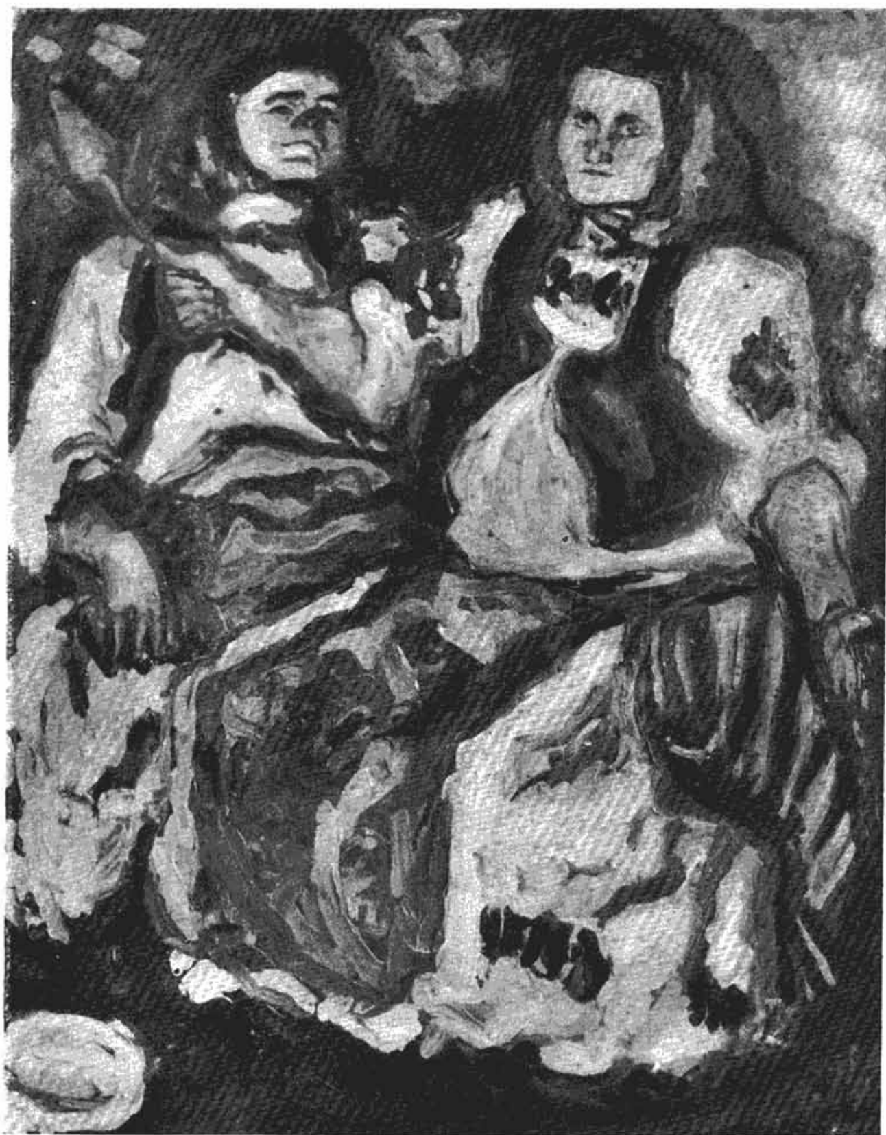
Сл. 8 — Зора Петровић: Композиција (1953 г.)