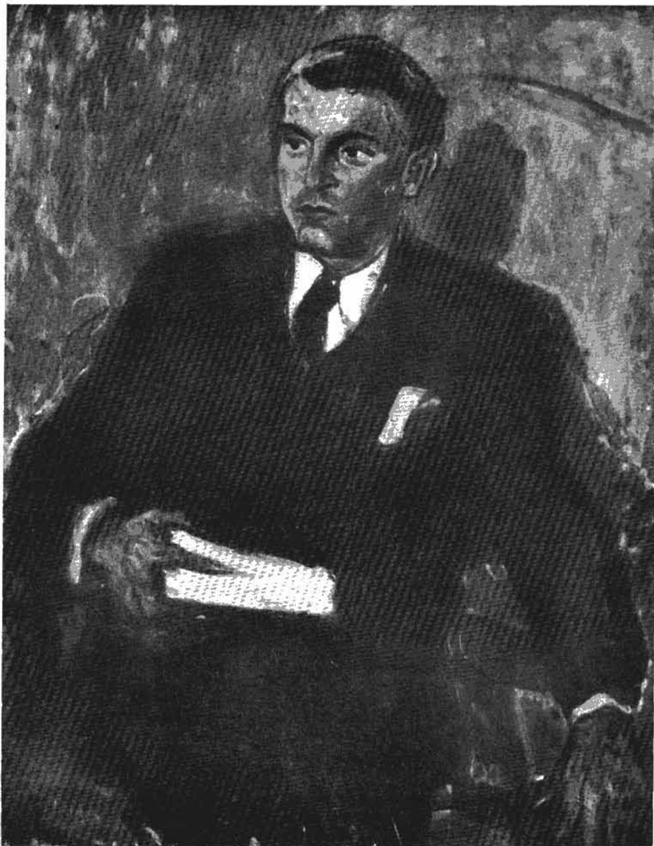
Сл. 2 — Зора Петровић: Портрет Павла Беџанског (1941 год.)