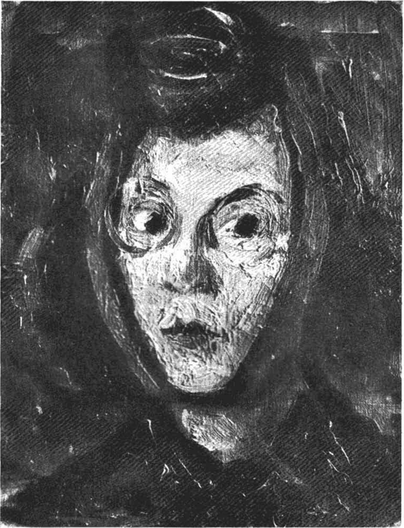
Сл. 3 — Зора Петровић: Аутопортрет (1946 год.)