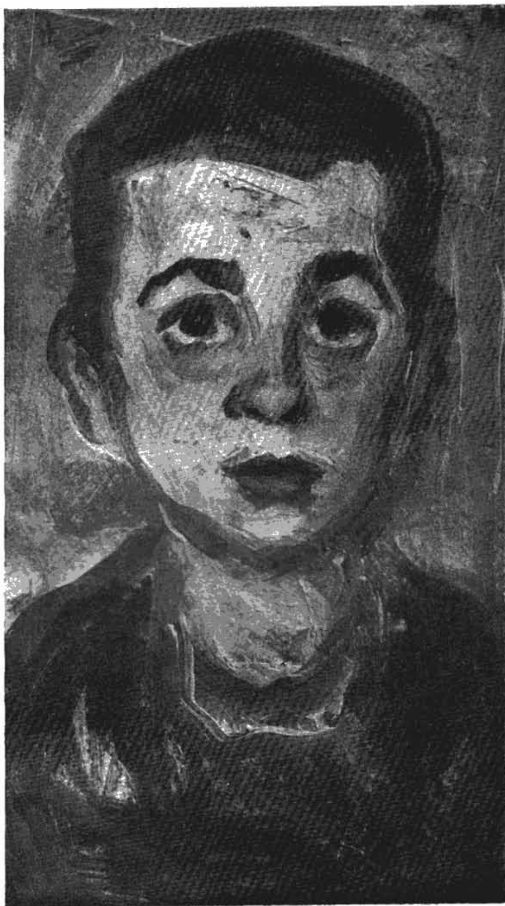
Сл. 5 — Зора Петровић: Портрет дечака (1956 г.)