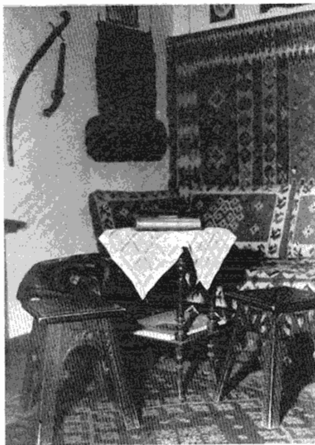
Сл. 2 — Један кутак из радне собе Стевана Мокрањца. (Својина Музеја града Београда)

Тако се завршавала ова мала изложба на којој је убедљиво музеолошки испричан живот, рад и смрт заслужног српског композитора кога генерације иза њега цене и поштују због свега што је у нашој још онда недовољно музички образованој средини дао.