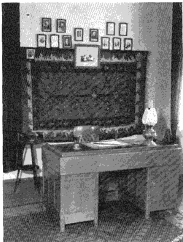
Сл. 1 — Писаћи сто из радне собе Стевана Мокрањца. (Својина Музеја града Београда)

ову кратку причу о животу и смрти једног нашег великог уметника.