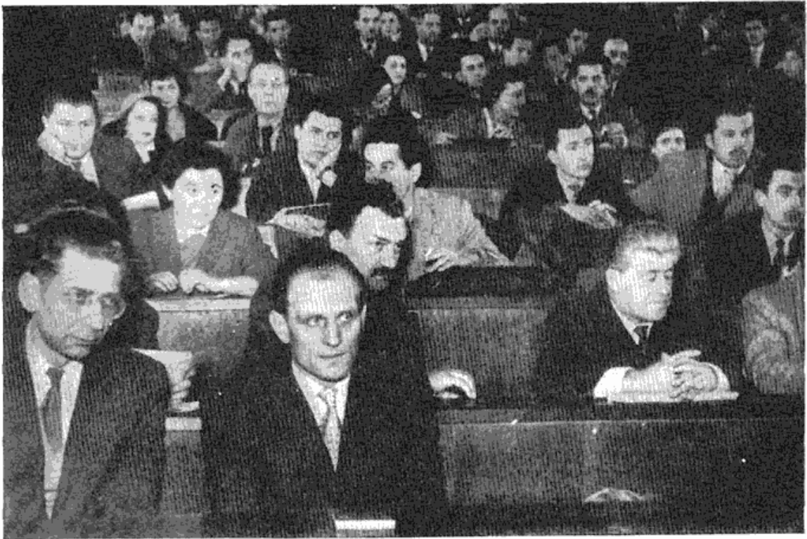
Сл. 1 — Са оснивачке скупштине Културно-просветне заједнице Београда

у оквиру Културно-просветне заједнице. Претставници народних универзитета такође су истакли потребу да имају свој савез у Културно-просветној заједници. Исто тако потврдили су и домови културе, такође подвлачећи неопходност свога савеза. Једино су претставници неких народних библиотека сматрали да је излишно њихово повезивање у један савез, кад, како они истичу, већ у Београду постоји Библиотечки центар, који не обавља само стручне послове него има у свом плану и низ задатака које предвиђа и Културно-просветна заједница, па су били мишљења да се Центар учлани у Заједницу, а не свака библиотека посебно. Иницијативни одбор, међутим, сматра, с обзиром на изванредно велику и значајну друштвену улогу библиотека, књижница и читаоница, и на њихов број, као и на њихово опште уклапање у заједничку културно-просветну друштвену делатност, без обзира на органе друштвеног управљања који постоје у њима (а органи друштвеног управљања, најзад, по-