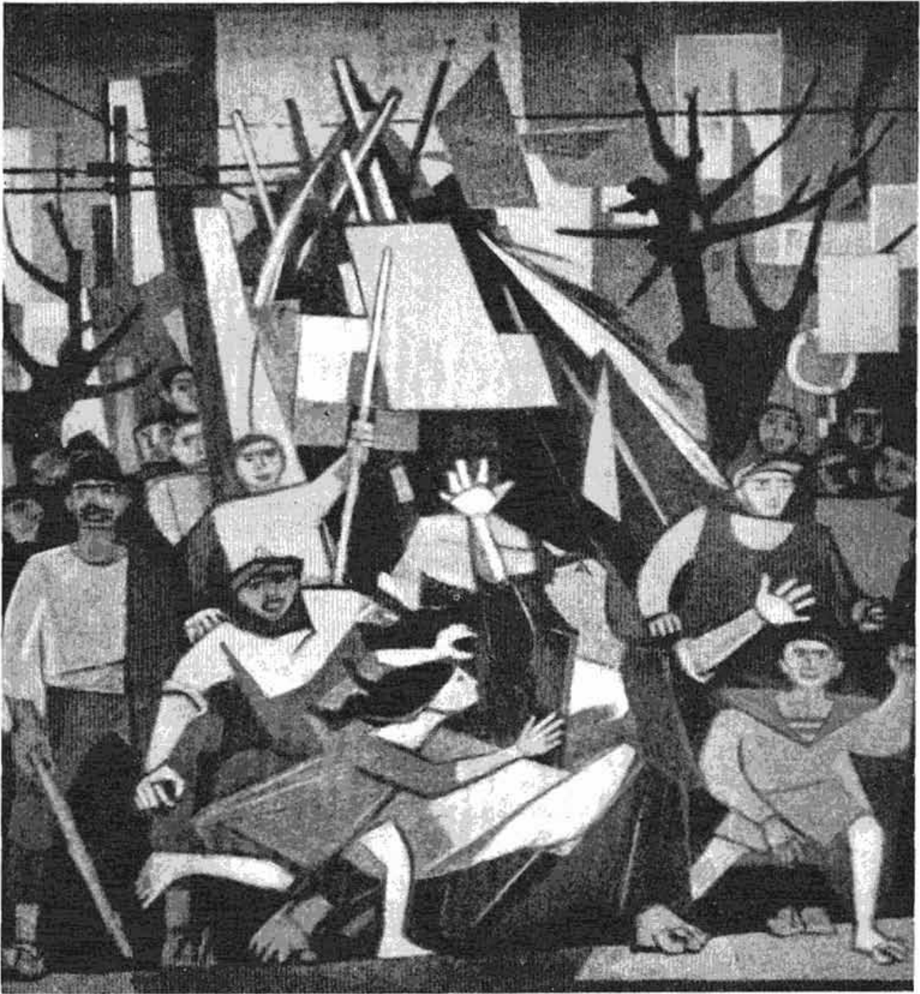
Сл. 2 — »27 Март 1941 године«, рад Мила Милуновића (деталј)

ми тешко падале. Одлучио сам да јој сада пишем опширније. У ретким хартијама, које је моја мајка сачувала за време рата, у лименој кутији, заједно са неким породичним сликама и очевим тапијама, нашао сам то писмо: