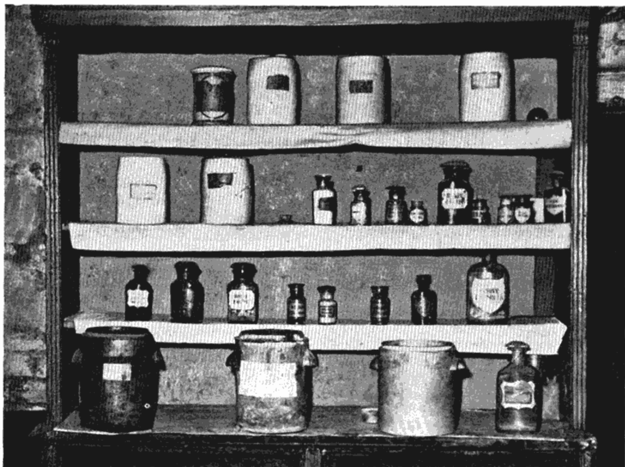
Сл. 1 — Део посуђа материјалке (собе за оставу) Прве државне апотеке у Београду. Налази се у подруму апотеке »Македонија«, Македонска улица бр. 32