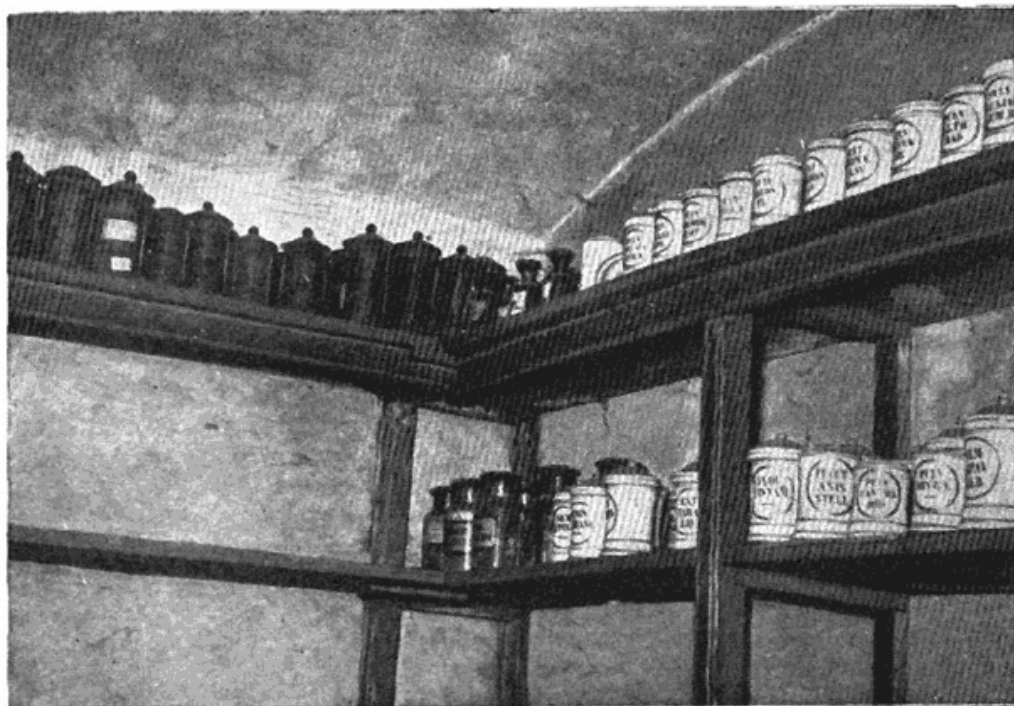
Сл. 5 — Део штајн-гефеса (апотекарског посуђа) Прве државне апотеке у Београду. На-лази се у подруму апотеке »Македо-нија«, Македон-ска улица бр. 32

где апотекар хоће, већ само у случају указане потребе и на месту које комисија буде одредила.