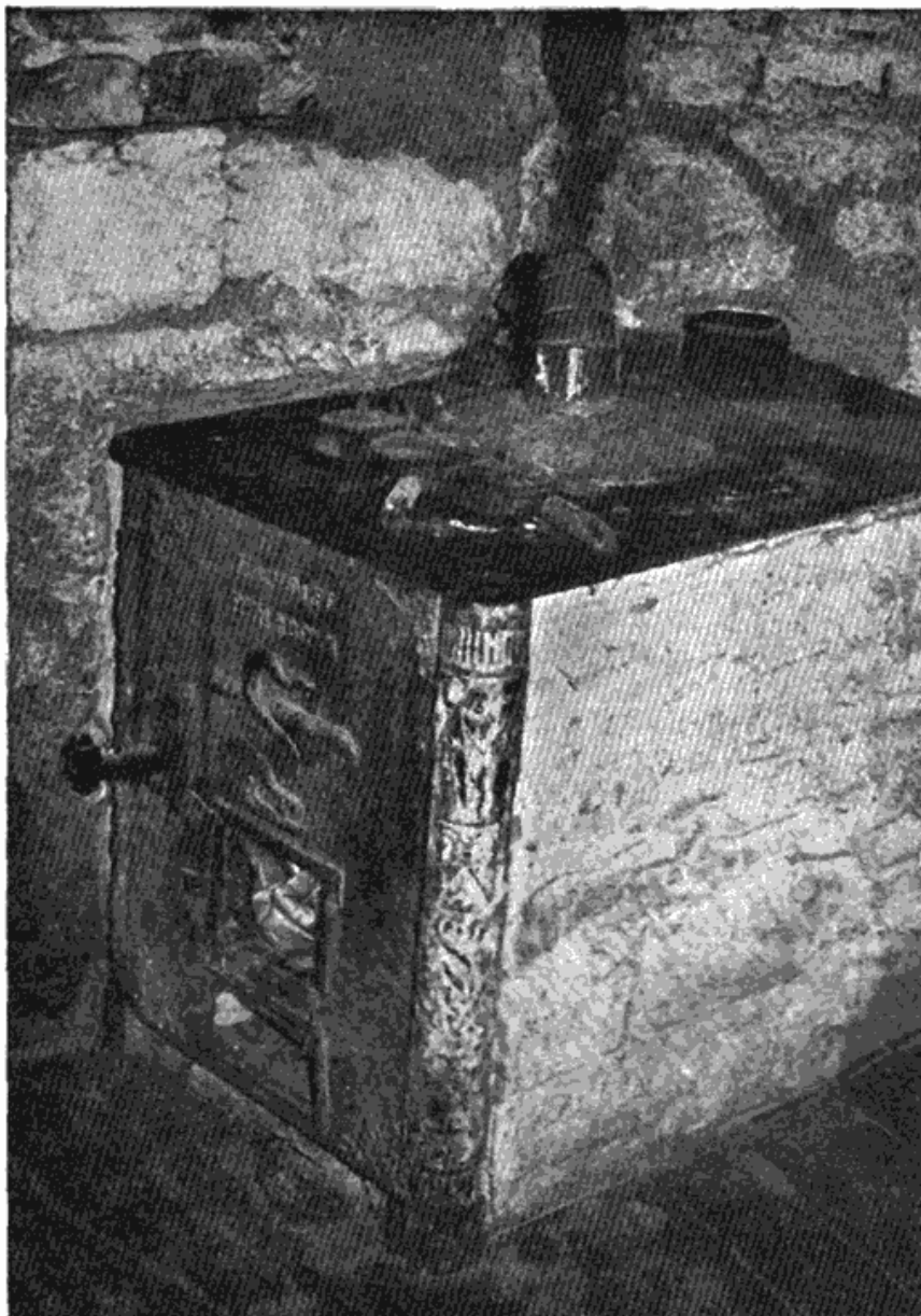
Сл. 3 — Дестилациони апарат Прве државне (правителствене) апотеке у Београду. Налази се у подруму апотеке »Македонија« у Македонској улици бр. 32