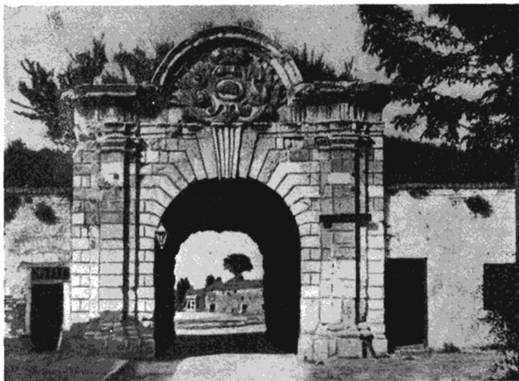
Сл. 3 — Капија цара Карла VI у Доњем граду

времена учртане су неке зграде у Доњем граду, које су испуњавале простор између савског и дунавског бедема и капије цара Карла: велика касарна за пешадију и друга за коњицу, магацин за храну, барутни магацин. О самој капији нема ни помена. Међутим, упоређујући њен положај у Доњем граду са ситуацијом која је била пре реновирања тврђаве, на основу гравира раног осамнаестог века, 5 може се закључити да је саграђена на месту некадање средњовековне капије, која је претстављала главни улаз са источне стране у Доњи град и по свој прилици била повезана са затвореним пристаништем. Између куле Небојше и овог улаза некад се пружао бедем са три куле осматрачнице. Основе ове три куле констатоване су и до капије цара Карла, приликом археолошких радова које је 1947 године изводио Археолошки институт Српске академије наука. 6