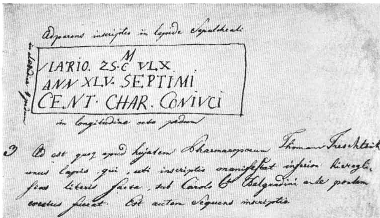
Сл. 1 — Натпис са Римског надгробног споменика