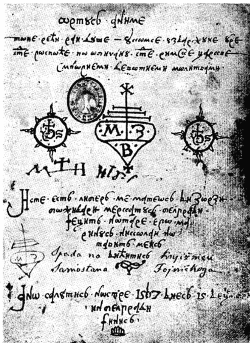
Сл. 4 — Насловни лист молитвеника »Ortus anime« написаног у Београду 1567 године

пао брак и примао мираз, акамоли да су се свршавали трговачки послови. Дубровчани то нису чинили ни у Београду: њихов капелан служио им је и као нотар, па им је писао тестаменте, склапао или оверавао пословне уговоре, формулисао брачне погодбе и пописивао инвентаре, али, како је он био полувзанично лице с компетенцијама које је изазвала нужда а не закон, његови акти увек су упућивани у Дубровник и ту, да би добили пуну правну вредност, регистровани, у присуству сведока, у