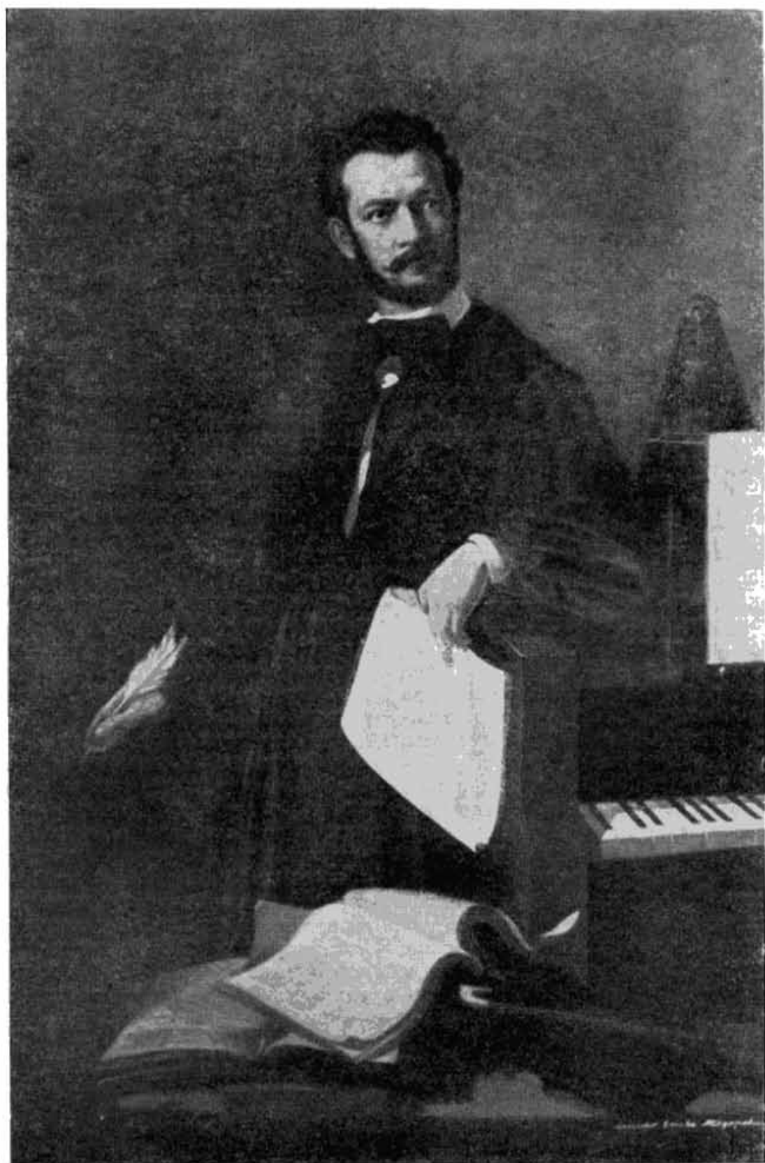
Сл. 1 — Портрет Корнелија Станковића — рад Стеве Тодоровића. Својина Народног музеја