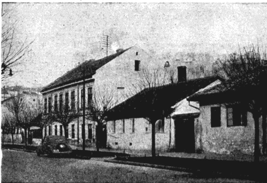
Сл. 2 — Остаци из некадашње Абаџиске улице: две приземне куће, снимљене 1937, доцније срушене

Међутим, у то време се, изгледа, већ имало лошег искуства са бесплатним дељењем плацева у Београду, јер су они остајали дуже времена неизграђени. Стога је Совјет захтевао да се поставе услови о обавезном грађењу кућа у одређеном року. Услов је био кратак и оштар: „... да сваки који плац добије дужан буде на истом за две године дана зданије подићи, иначе да се исти од њега одузме и другоме даде...“ Поред тога је имао да „сваки за свој плац за тапију по класи којој они принадлеже плати“ што се очигледно односило на таксе око преноса власништва.