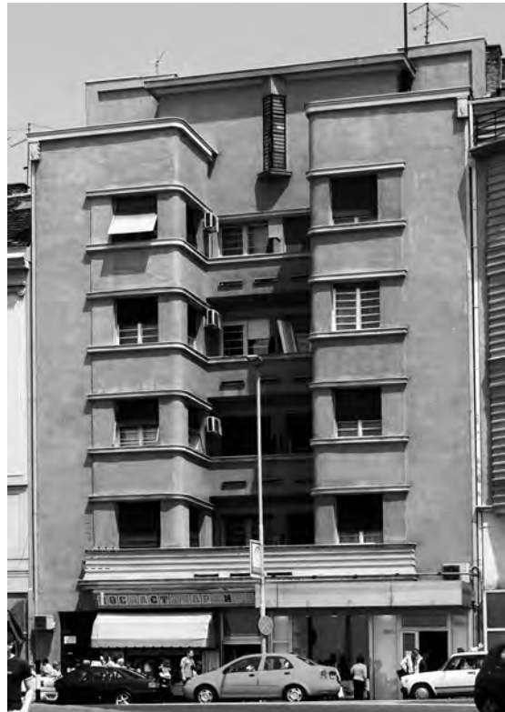
Слика 10. Д. Брашован, зграда на Зеленом венцу 10

Брашован је 1930. године званично приступио Групи архитеката модерног правца. Овај догађај био је значајан за Групу пошто је у то време Брашован већ био признат архитект који се, и поред академских почетака, окретао модерној архитектури. Било је потребно неко време да он превазиђе чисто формалну и декоративистичку употребу модернистичког језика, али су крајњи резултати били објекти који се сматрају најзначајнијим примерима српског међуратног модернизма. 56 Од