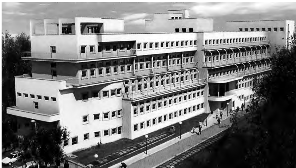
Слика 3. М. Злоковић, Дечја универзитетска клиника у Београду (компјутерски модел, Perović M. R., op.cit. )