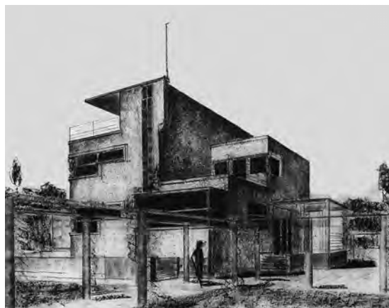
Слика 6. Б. Којић, нереализовани пројекат Вила на Топчидерском брду (Perović M. R., op.cit. ) Fig. 6 B. Kojić, Project "Villa at Topčidersko Brdo", unrealized project

дини. Од његових пројеката из периода пре оснивања Групе архитеката важно је поменути Хируршко-уролошки павиљон у Београду, који је у српској архитектури био први изграђен јавни објекат осмишљен по принципима функционализма.