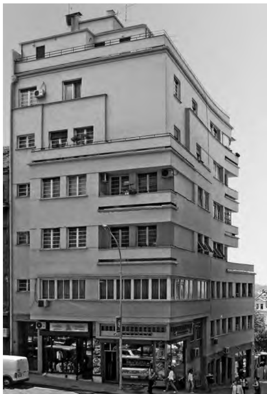
Слика 7. Б. Којић, зграда у Призренској улици 7 Fig. 7 B. Kojić, Building at No. 7 Prizrenska Street

виле, један комплекс станова и један ентеријер, све на Топчидерском брду, који су тада представљали врло напредну интерпретацију модерних принципа градње у свету, подсећајући на дела Ле Корбизјеа и Гропијуса. Нажалост, ниједан од ових радова није реализован, а исту судбину доживели су и многи пројекти јавних објеката, израђени за конкурсе широм Југославије, који су осмишљени у модерном духу.