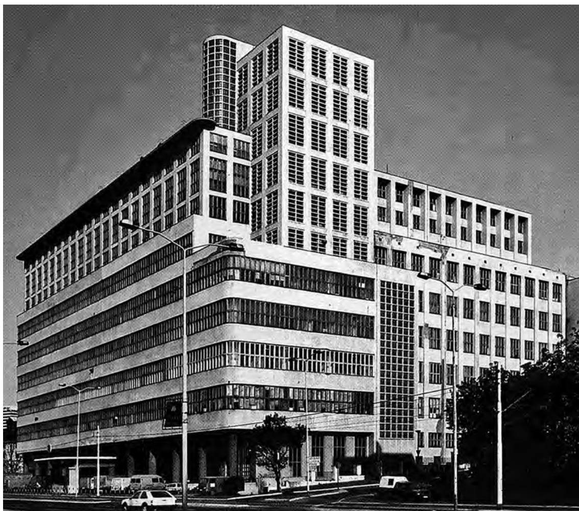
Слика 11. Д. Брашован, зграда Државне штампарије на Булевару војводе Мишића 17 (Кадијевић А., op.cit. , 1990)