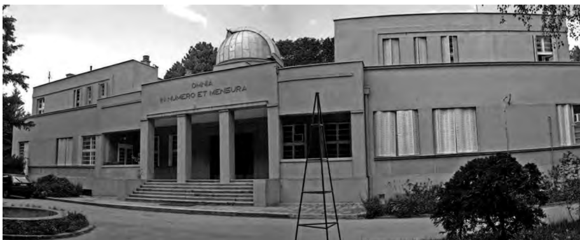
Слика 4. Ј. Дубови, Астрономска опсерваторија у Београду, данашњи изглед управне зграде Fig. 4 J. Dubovi, Astronomy Observatory, Belgrade, the present appearance of the administration building

Добио је прилику да у просторном распореду донекле примени своје напредне урбанистичке идеје о вртном граду и здравом становању. И мада фасаде свих зграда овог комплекса споља прате функционално решење унутрашњости, још увек су видна и обележја академизма, као што су симетрични распоред и плитки рељефи.