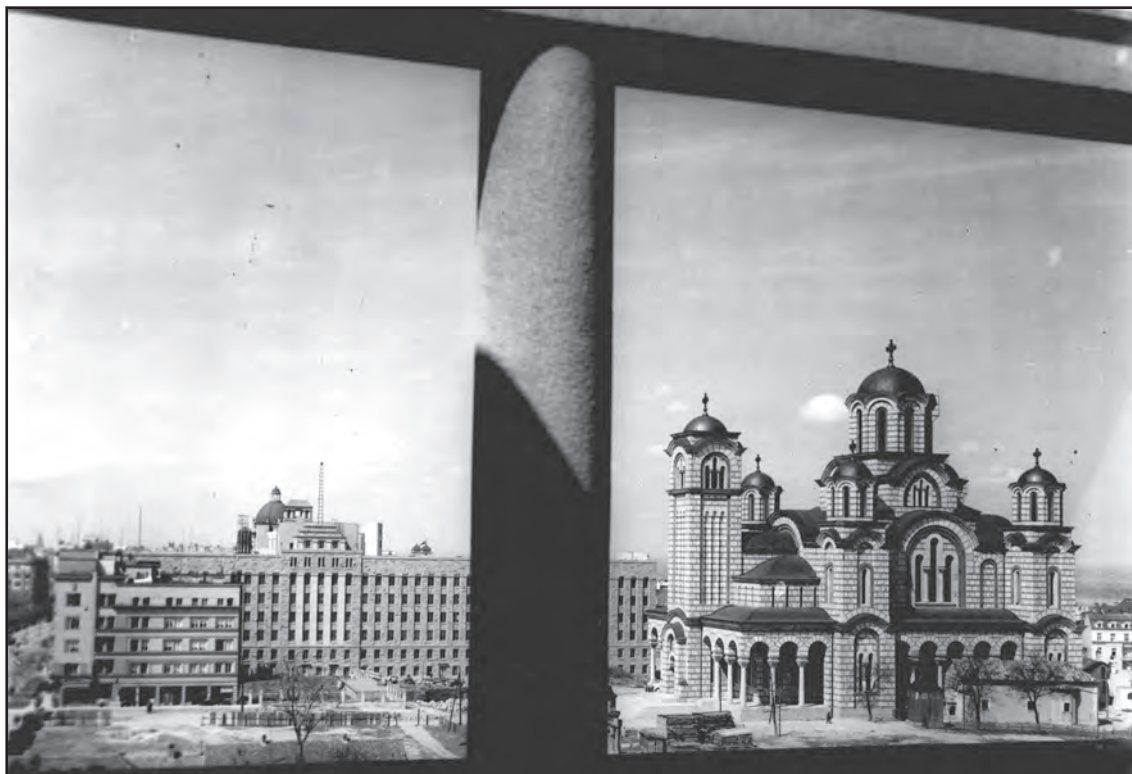
Сл. 1. Фотографија цркве св. Марка. 1939. године, са терасе зграде ресторана „Мадера“. Капела Радовановића се види у средини фотографије, делимично заклоњена стубом