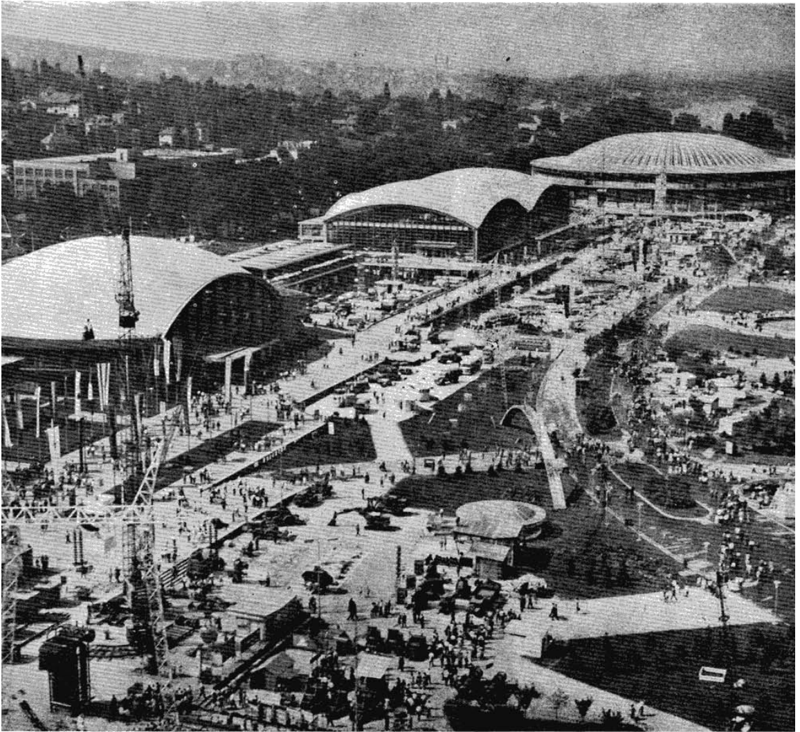
ПАНОРАМА САЈАМСКИХ ХАЛА.