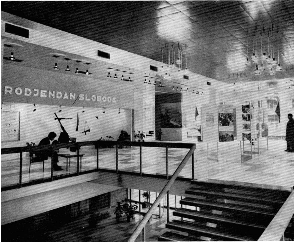
ПРИЛАЗ СА ПОГЛЕДОМ НА УВОДНИ ДЕО ИЗЛОЖБЕ