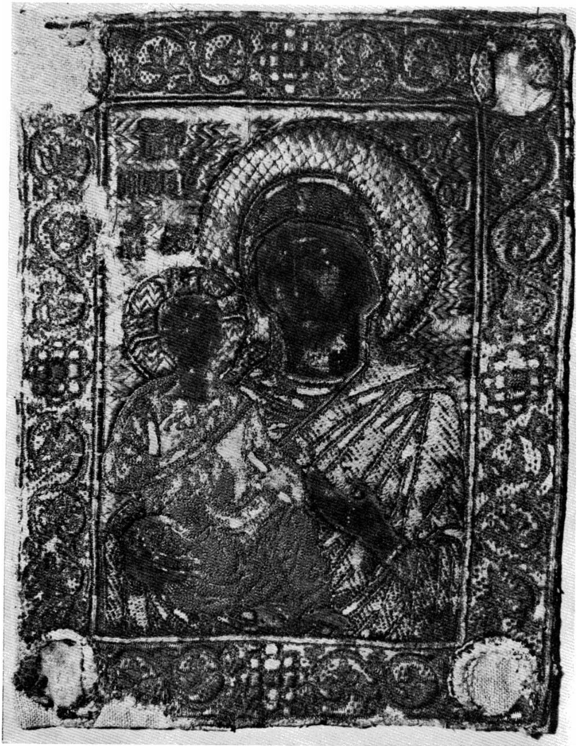
БЕЗЕНА ИКОНА ИЗ XVI БЕКА.